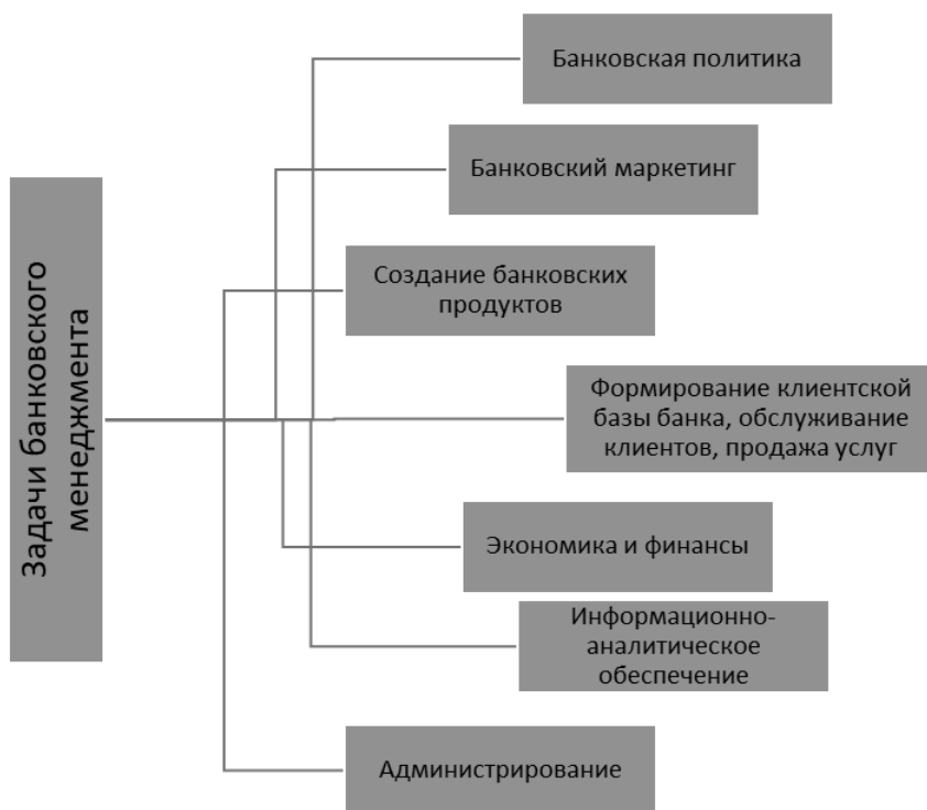
Рис. 1. Задачи банковского менеджмента

Неуклонное углубление рыночных отношений и постепенный подъем экономики неразрывно связаны с укреплением банковской системы. Являясь финансовыми посредниками между субъектами рыночных отношений, банки одновременно выступают непосредственными участниками рынка, что требует постоянного поиска средств удовлетворения спроса и обеспечения соответствующего предложения на развивающемся рынке банковских услуг, создания благоприятных условий для развития конкуренции и выхода на международный уровень. В этой связи, острой необходимостью становится совершенствование системы менеджмента банковской сферы.