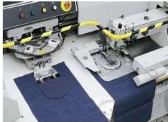
Рисунок 1а, 1б. Панель управления и процесс обработки накладного кармана автомата марки 806N-111100-01 фирмы «Durkopp Adler».

В данном автомате накладной карман пришивается с максимальной эффективностью. Изменения и приспособления к карманным формам могут быть заменены за короткое время. Можно обрабатывать полосатые и клетчатые ткани с совмещением рисунка непосредственно на швейном автомате без проблем.