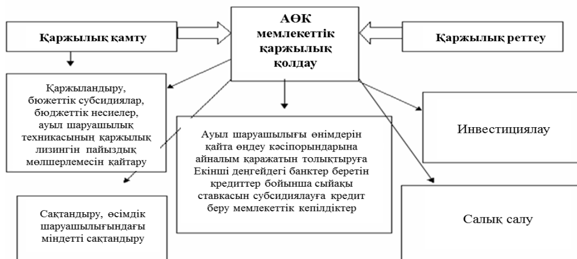
Сурет 1 - Аграрлық секторды мемлекеттік қолдау шаралары

Ауыл шаруашылығы экономикасын жанама мемлекеттік реттеу шараларына мыналар жатады: