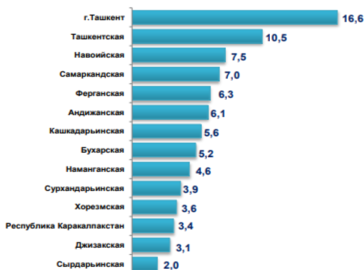
Рисунок 1. Участие регионов в формировании ВВП за 2022 год (в % к итогу)

При этом анализ объемов строительных работ по районам Бухарской области показал различную тенденцию в разные годы. Под строительными работами принято понимать совокупность работ, выполняемых непосредственно на строительном объекте при возведении конечной продукции (зданий, сооружения, других построек).