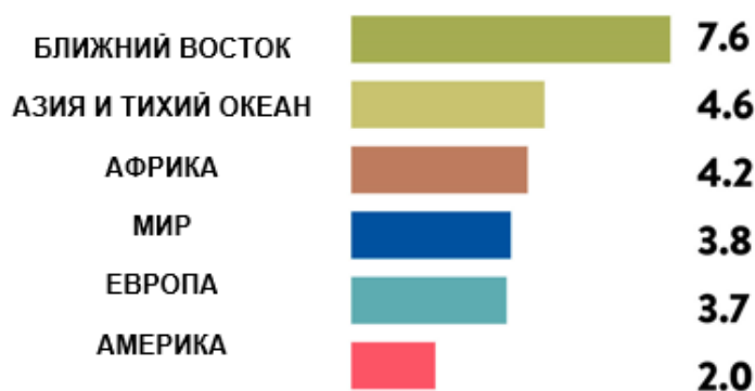
Рисунок 2. Международные туристические поездки в 2019 году – изменения по регионам, %

Во всех регионах наблюдался рост международного туризма, при том, что неопределенность вокруг Brexit, крах туроператора Thomas Cook, геополитическая и социальная напряженность и спад мировой экономики совместно способствовали некоторому замедлению роста в 2019 году по сравнению с исключительными темпами в 2017 и 2018 годах. Ближний Восток стал самым быстрорастущим регионом по числу международных туристических поездок в 2019 году, почти вдвое превзойдя средний мировой показатель (+8%) (рисунок 2).