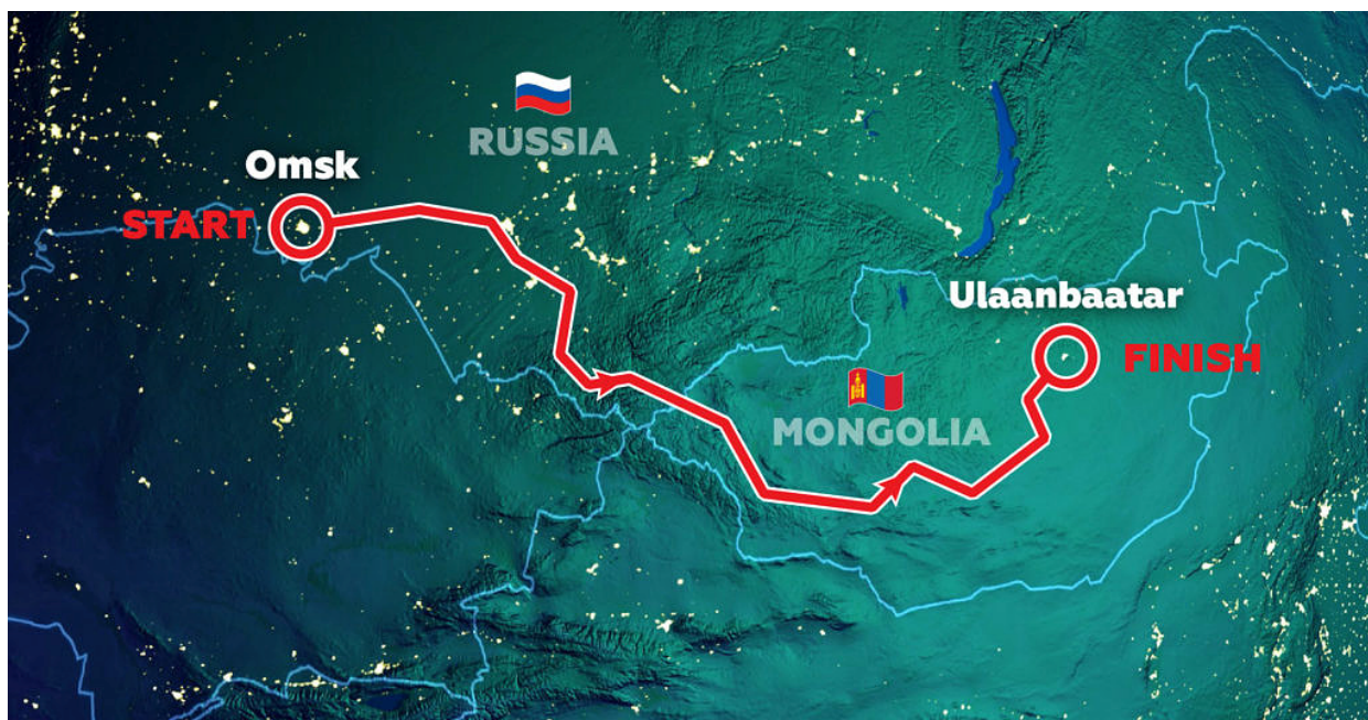
Рисунок 3. Карта маршрута ралли «Шёлковый путь»

При этом Узбекистану следует максимально пользоваться возможностями путешествий по Великому Шелковому пути. К примеру, международное ралли «Шёлковый путь», традиционно проводимое в середине лета, ежегодно принимает участников из более чем 40 стран: выставляется лучшая гоночная техника – мотоциклы, квадроциклы, внедорожники и грузовики. В течение двух недель маршрут ралли пересекает территории нескольких стран, а за событием следят миллионы телезрителей по всему миру. В 2021 году в маршрут ралли планируют включить регионы, ранее не использованные в других изданиях ралли-рейда: Алтай на территории России, Монгольский Алтай и Гоби (рисунок 3) [6].