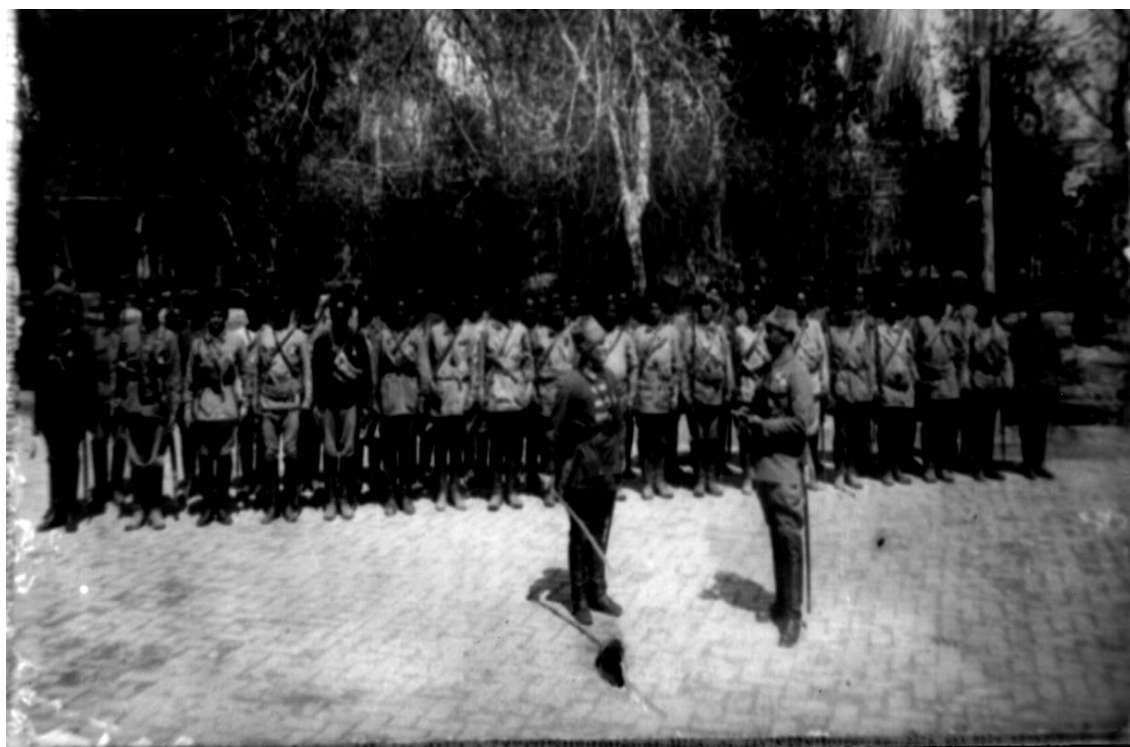
Rasm 7: Buxoro Qoshun Qismlari