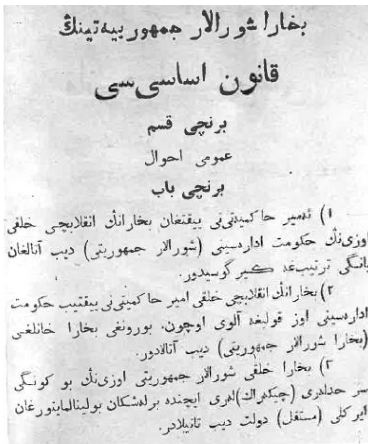
(Rasmlar 6: Buxoro Qonuni Asosisi 1. beti)