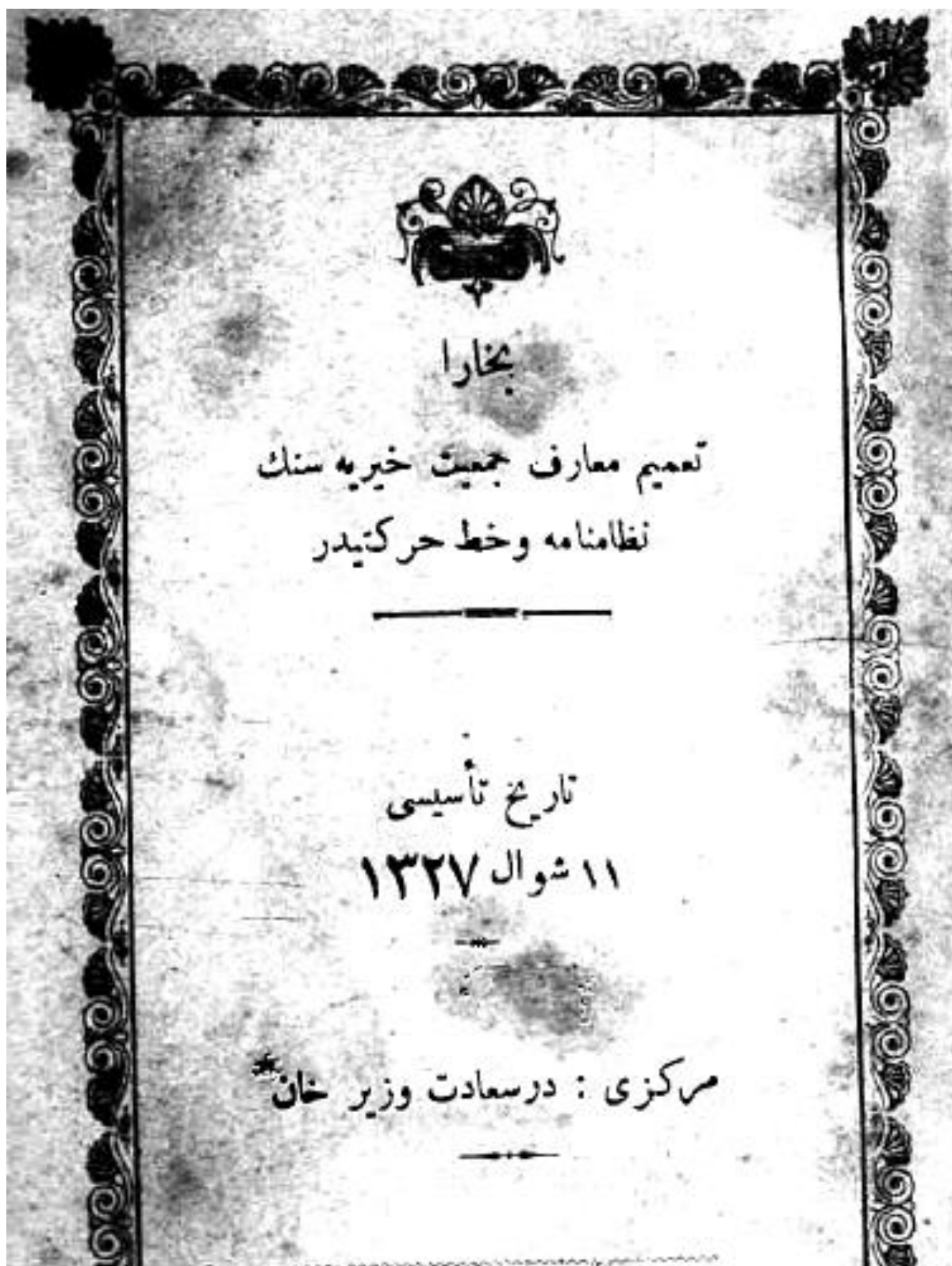
Rasm 2: Buxoro Ta'mim-i Maarif Jamiyati Nizomnomasi