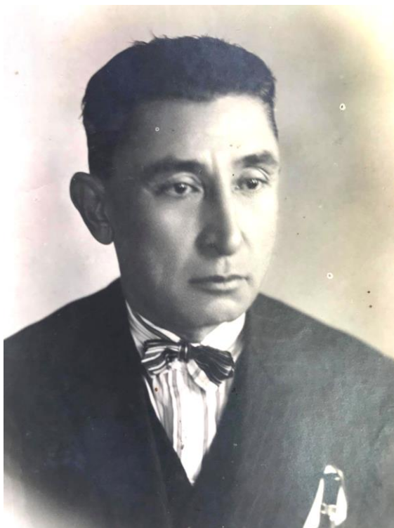
Rasm 9: Usmon Xo'ja İstanbulda 1927-yil