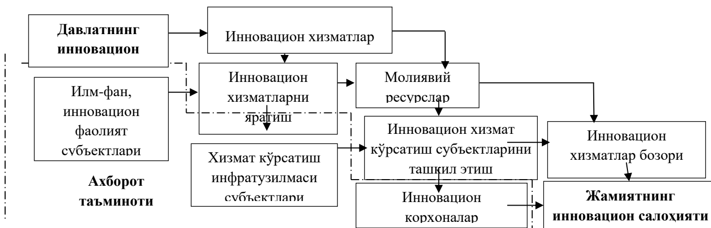
2-расм. Хизмат кўрсатиш соҳасидаги корхоналарнинг инновацион фаолиятини бошқариш 7