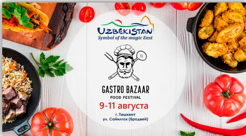
2-расм. Биринчи Халқаро гастрономик фестивалъ логоси

Ушбу ўзаро ҳамкорликнинг натижаси сифатида, 2019 йилнинг 9-11 Август кунларида Тошкент шаҳрида биринчи Халқаро гастрономик фестивалъ Gastro Bazaar-2019 бўлиб ўтди (2-расм) 3 . Ушбу фестивалъ давомида республикамизнинг барча вилоятларида пишириладиган машхур таомлар, мева-сабзавотлар, ширинликлар ва шоу дастурлар намоиш этилди.