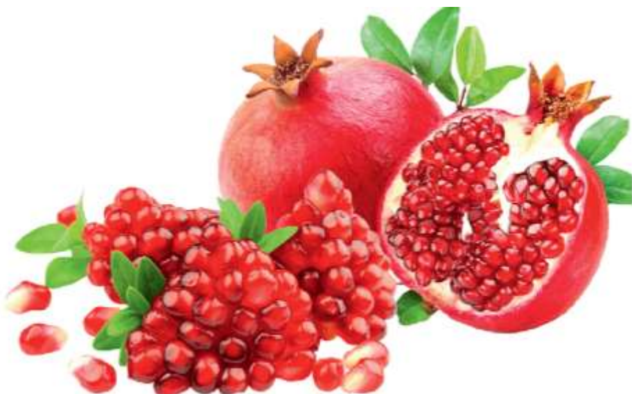
7-rasm. Anor mevasining ko‘rinishi

Sovuqqa chidamli subtropik o‘simliklar navlarni yaratishda Umumittifoq subtropik selektsiya stantsiyasi katta muvaffaqiyatlarga yega bo‘lib, bir qator sovuqqa chidamli navlari yaratilgan. Oxirgi yillarda O‘zbekiston mustaqilligiga yerishilgandag so‘ng ko‘p ko‘lamli ishlar subtropik mevali o‘simliklarni o‘sishi, rivojlanishi va hosildorlik ko‘rsatkichlarni turli xil tuproq- iqlim sharoitida hamda ilmiy asoslangan resurstejamkor texnologiya asosida parvarishlab, xurmo, anor, anjir, zaytun, feyxoqa kabi o‘simliklarni navlarini yaratibularga mos keladigan muttasil va sifatli hosil beradigan navlar yaratilmoqda. Xususan, bu ishlar O‘zbekiston bog‘dorchilik, uzumchilik va vinochilik ilmiy tadqiqot institutida hamda mazkur institutni viloyat filiallarida mavjud ilmiy tajriba- stantsiyalarida serhosil subtropik mevali navlar yaratish hamda ularga mos keladigan resurs tejamkor innovatsion texnologik parvarishlash omillari ishlab chiqarib tavsiyalar tayyorlanmoqda va ushbu tavsiyalarni keng joriy qilish uchun keng ko‘lamli ishlar olib borilmoqda.