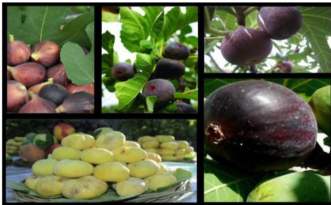
5-rasm. Anjirni koʻrinishi va mevalari

Парваришлaш. Анжир кишга кўмиладиган субтропик экин тури. Уни бутасимон шакллантириш кишга кўмишни кулайлаштиради. Бунда асосий 3–4 та йирик шох қолдирилади. Қишдан чиққан анжир туплари новдаларини 1/3 қисмига қисқартирилади. Қалинлашиб кетган шохлар сийраклаштирилади, бу ҳосилни камайтирмасдан, балки анжир тупини ичига шамол, куёш нури киришини таъминлайди.