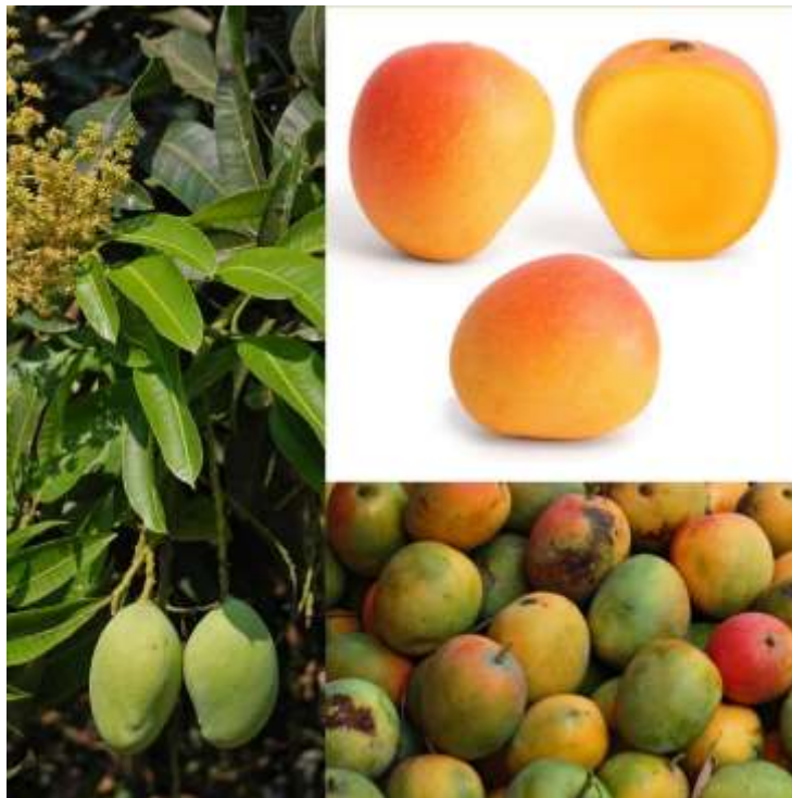
8-rasm. Mango mevasining ko‘rinishi

tashkil qiladi. Har yili 2 mln. tonna mango mevasi yetishtiriladi. Mango Hindistondan tashkari Veytnam, Birma, Xitoy, Pokiston, Indoneziya, Yegepit, Braziliya, Meksika davlatlarida o‘stirilib muttasil mo‘l va sifatli hosil olinadi. Mangoni 90 navi uchraydi, eng keng tarqalgan navlar - Alfonso, Mulgoba, Servan, Kent Xoden kabilar keng tarqalgan.