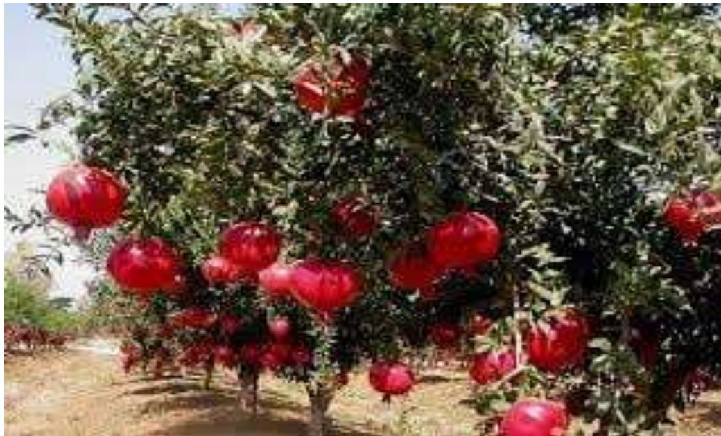
6-rasm Anor daraxti va mevasini rorinishi

Anor ko'chatlari o'tqazilgan dastlabki yili o'sish davri davomida 10-12 marta (gektariga 600-700 m 3 me'yorda) sug'oriladi. Anorzor tuprog'ining namligi dalaning to'liq nam sig'imiga nisbatan 75-80% bo'lishi talab etiladi.