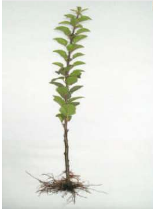
9-rasm. Olmaning M-9 sust o'suvchi vegetativ payvandtagi