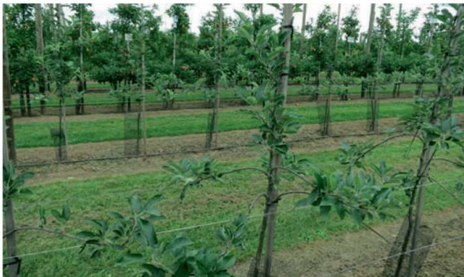
10-rasm. Intensiv olma bog‘ining ko‘rinishi