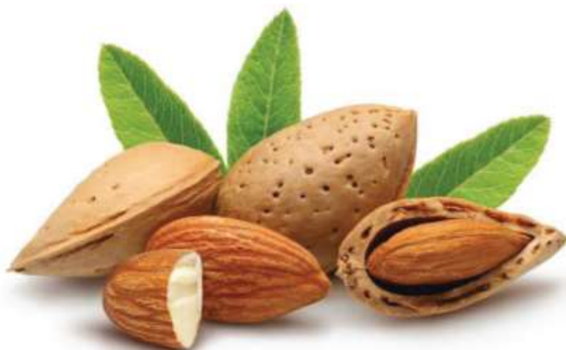
4-rasm. Bodom mevasining ko‘rinishi

Yong‘oqli mevalilar uzoq yashaydi, yong‘oqlar tarkibida 96-98% yog‘, oqsil va uglevodlar mavjud. Yong‘oq mevasi tarkibida barcha vitaminlar V guruhi hamda A, Ye, R-lar ham mavjud.