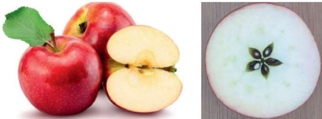
1-rasm. Olma mevasining tashqi va ichki ko‘rinishi

2.2. Urug‘li mevali o‘simliklarni kelib chiqishi va tarqalishi, qisqacha biologik tarifi va botanik tasnifi.