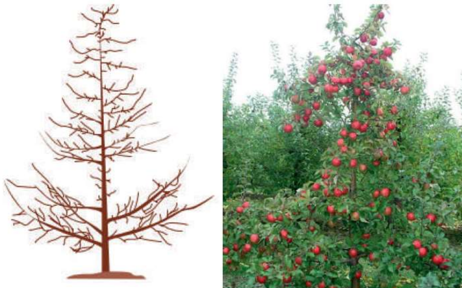
11-rasm. Bir yarusli markaziy lider usulda shakl berish

Meva o‘simliklarda novda skeletlarining Shoxlanishga moyilligi ko‘p jihatdan bu ko‘rsatkichlarni oshib borishi daraxtlarni morfo-biologik xususiyatlari hamda mevali o‘simliklarni o‘sishi va rivojlanishiga chambarchas bog‘liqdir. Novdalarni yo‘g‘onligi va o‘sinh kuchi asosan meva o‘simliklarni biologik xususiyatlari hamda o‘sinhini yashash sharoiti hamda bu navlarni o‘sinh va rivojlanishiga chambarchas bog‘liq hisoblanadi.