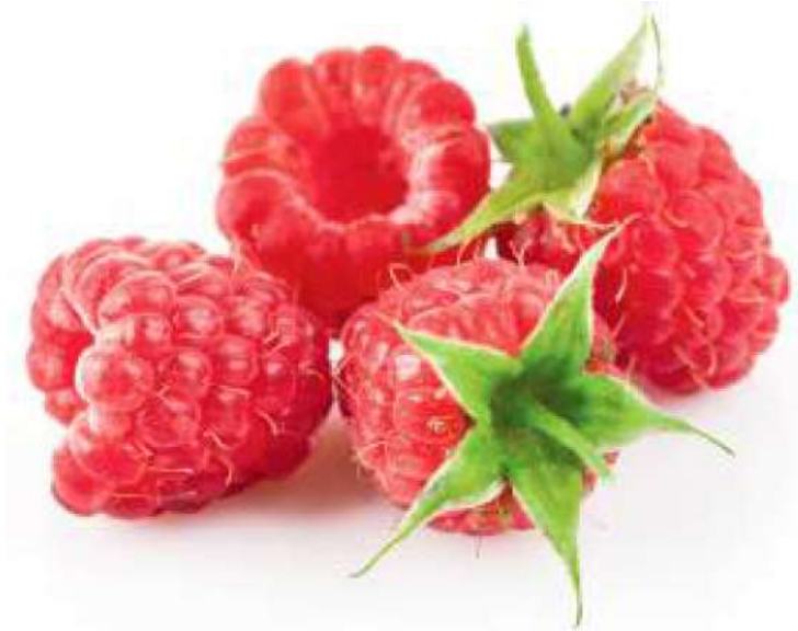
3-rasm. Malina mevasining ko'rinishi

Qulupnayni biologik xususiyatlari. Qulupnay ko'pchilik o'tsimon mevalilar toifasiga kiradi. Ko'p yillik qismi o'sish poyalari 0,5-2 sm bo'ladi. Ikkilamchi novdalar toifasiga ularni muylovchalarini hisoblash mumkindir. Qulupnayni mo'ylovchalaridan yangi o'simlik paydo bo'ladi. Har bir onalik o'simlik 10-30 mo'ylovcha berishi mumkindir. O'sish davrida qulupnay 3-4 barglarni generatsiyasini o'tkaziladi. Qulupnayni ildiz tizimi 2-3 ildizdan va 90%, ildizlar tuproqni unumdor qatlamida joylashkan. Qulupnayni o'sish va rivojlanishi 5-8°S issiqlikda boshlanadi, eng yaxshi temperatura gullash uchun 15-20°C hisoblanadi.\