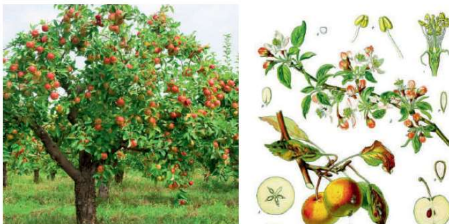
12 -rasm. Olmaning morfologik va generativ ko‘rinishi

Daraxtlarda kurtaklar bo‘rtishidan to barglar sarg‘ayib to‘kilgunicha bo‘lgan davr vegetatsiya davr deb ataladi.