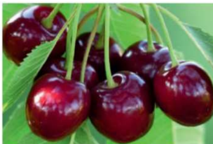
2-rasm. Gilosning “Bahor” navi.

O‘zbekistonda meva va rezavor meva ekinlarning 108 ta turi uchraydi, 73 ta turi madaniylashtirilgan bo‘lib, shundan 25 ta turi keng tarqalgan. Danakli mevalilarni meva daraxtlari, mevalarning yirikligi, rangdorligi, yaxshi saqlanishi, tashishga chidamliligi hamda sanoat uchun qimmat baho xom-ashyo ekanligi va to‘yimlilik, bir yerda uzoq yashab mo‘l hosil berish bilan boshqa ekinlardan farq qiladi. Danakli mevali daraxtlarni o‘ziga xos yana bir xususiyati shundan iboratki, deyarli hamma madaniy meva daraxtlari payvandlash (asosan kurtak payvand) yo‘li bilan ko‘paytiriladi.