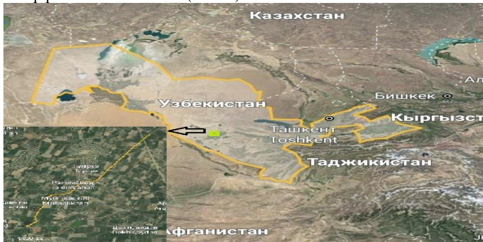
1-rasm. Buxoro viloyati Arablar kollektorining xaritasi

Tadqiqot natijasi: 2022-2023-yillar davomida tadqiqot obykti hisoblangan Arablar kollektorida tadqiqot ishlari olib borildi. (1-rasm).