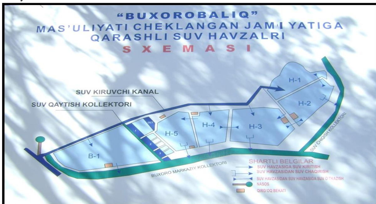
1-rasm. Buxorobaliq MCHJ suv havzalar xaritasi

Baliqchilik hovuzlaridan fitoplankton namunalari yig'ishda Apshteyn va Djeddi to'ridan foydalanildi. Kapron to'r № 76 markali bo'lib, suv kirish halqasining diametri 20 sm edi. Maxsus tayyorlangan shisha idish bilan mikroskopik suvo'tlarining soni va miqdori aniqlandi. Buning uchun hovuzlarning turli nuqtalaridan 0,8-1,0 m chuqurlik qismidan fitoplankton namunalari yig'ildi va fiksatsiyalandi.