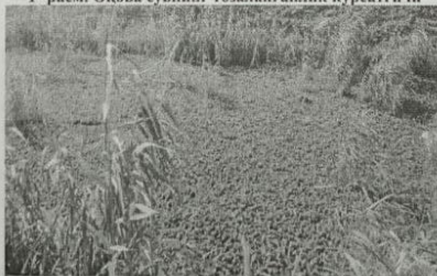
2-расм. Паррандачилик корхонаси оқова сувларини биологик ҳовузларда пистия ўсимлиги ёрдамида тозалаш