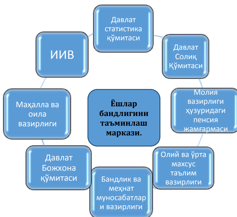
3-расм. Ўзбекистон шaroитида автоматлаштирилган ёшлар бандлиги мониторингини яратишда маълумотлар базаси интеграциялашуви

Айни пайтда “Бухоро тажрибаси” сифатида Бухоро вилояти ҳокимлиги Ёшлар масалалари бўйича вилоят идоралараро Кенгаши қарори билан тасдиқланиб, Бухоро вилоят Ёшлар агентлиги ҳузурида “Ёшлар бандлигини таъминлаш маркази (“Call-centre”) фаолияти йўлга қўйилди. Бухоро давлат университетининг бир қатор мутахассислари ҳамда вилоят Ёшлар агентлиги ҳамкорликда мазкур марказ учун Ўзбекистон Республикаси давлат бошқаруви органларининг маълумотлар базалари билан интеграциялашган электрон платформани яратиш бўйича амалий ишлар олиб бормоқдалар.