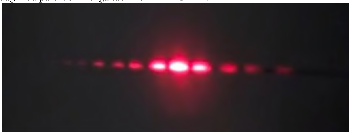
3-rasm: Haqiqiy interferentsiya sxemasi

Simulyatsiyamizni ishga tushirgandan so'ng, biz 2-rasmda ko'rsatilgan natijalarni ko'rish va ularni 3-rasmdagi haqiqiy interferentsiya sxemasi bilan solishtirish uchun quyidagi kod parchasini ishga tushirishimiz mumkin.