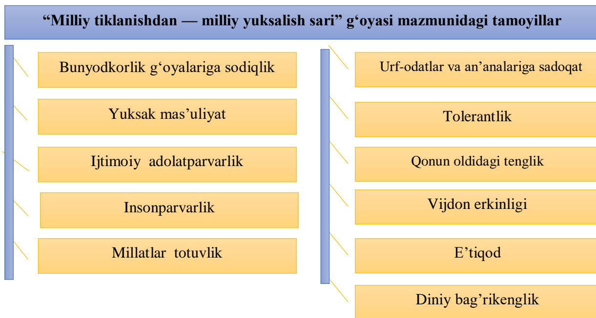
2-rasm. Milliy tiklanishdan — milliy yuksalish sari g‘oyasining tamoyillari

“Milliy tiklanishdan — milliy yuksalish sari” g‘oyasi jamiyatda sog‘lom dunyoqarash va bunyodkorlikni umummilliy g‘oyaga aylantirishga, oila, ta‘lim tashkilotlari va mahallalarda ma‘naviy tarbiyaning uzviyligini ta‘minlashga targ‘ibot-tashviqot va tarbiya yo‘nalishidagi ishlarni ilmiy jihatdan tashkil etishga, sohadagi tadqiqot ishlari samaradorligini oshirishga, ijtimoiy-ma‘naviy muhit barqarorligini mustahkamlashga qaratilgan tizimini tashkil etish, el-yurt taqdiriga loqaydlik, mahalliychilik, urug‘-aymoqchilik, korrupsiya, oilaviy qadriyatlarga bepisandlik va yoshlar tarbiyasiga mas‘uliyatsizlik kabi illatlarga barham berish, internet, jahon axborot tarmog‘idan foydalanish madaniyatini oshirish, g‘oyaviy va axborot xurujlariga qarshi mafkuraviy immunitetini kuchaytirish, madaniyat, adabiyot, kino, teatr, musiqa va san‘atning barcha turlari, noshirlik-matbaa mahsulotlari, ommaviy axborot vositalarida ma‘naviy-axloqiy mezonlari, milliy va umuminsoniy qadriyatlarning ustuvorligiga erishish, geosiyosiy va mafkuraviy jarayonlarni muntazam o‘rganish, terrorism, ekstremizm, aqidaparastlik, odam savdosi, narkobiznes va boshqa xatarli tahdidlarga qarshi samarali g‘oyaviy kurash olib borish hamda bu borada xalqaro hamkorlik aloqalarini rivojlantirish belgilangan tamoyillarning hayotdagi ijrosini ta‘minlashga xizmat eiladi [4].