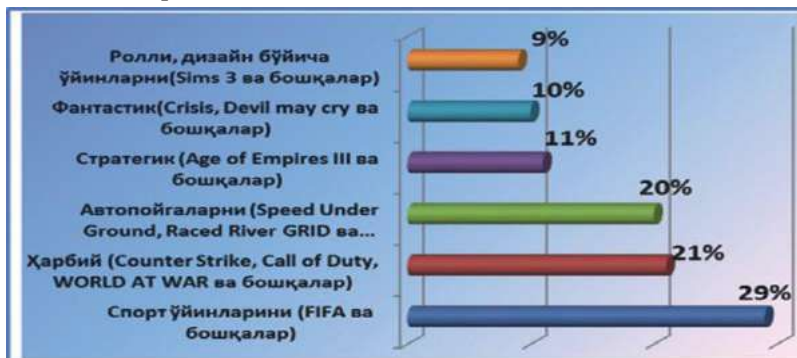
2-rasm: O'yinlarining ommaviyligi tavsifi 5

virtual qaramlik domida qolgan yoshlarning aqliy va ruhiy holatini tiklash va ularni himoya qilish maslasi dolzarb bo'lib qoladi.