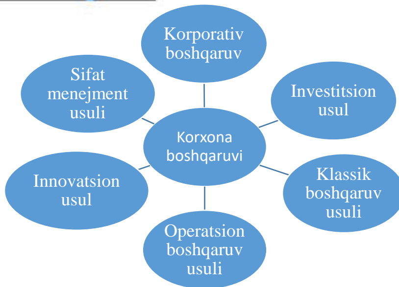
2-расм. Функционал бошқарув усуллари.

Менежмент методологиясини асосий назария йўналишларидан бири бошқарув механизми ҳисобланади. Амалиётда механизм тушунчаси ҳолат ҳисобланиб бир неча бўлак шаклланиб яхлит бир тизим яратилади. Демак, менежментнинг ёки бошқарув фаолиятининг самарадорлигини ошириш учун менежментни яхши шакллантириш лозим. Бунинг асосида бир қанча элементлар, катта ва кичик тизимчалар туради. Фаолиятни тўғри ташкил этиш ва такомиллаштириш учун илмий тадбирлар ва изланишлар олиб боришимиз зарур. Авваламбор, механизмни жорий қилиш учун қуйидагиларни жойлаштириш мумкин. Биринчидан катта тизимлар, сўнгра кичик тизимчалар.