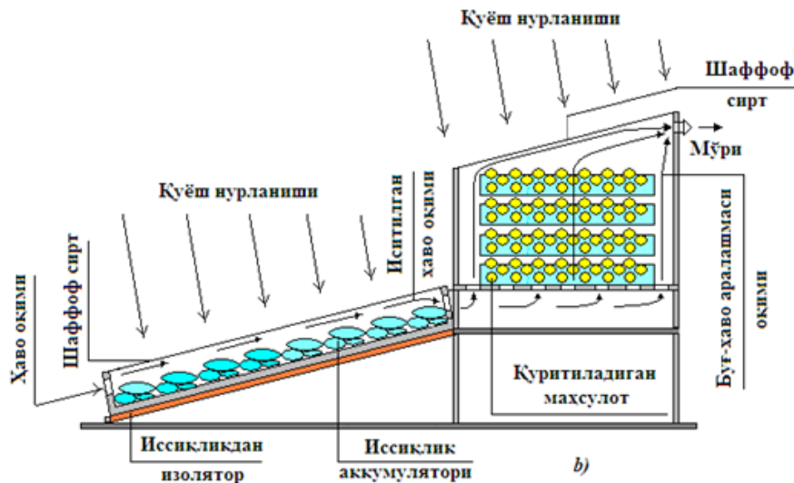
5-расм. Аралаш турдаги куёш қуригичларининг схемаси: