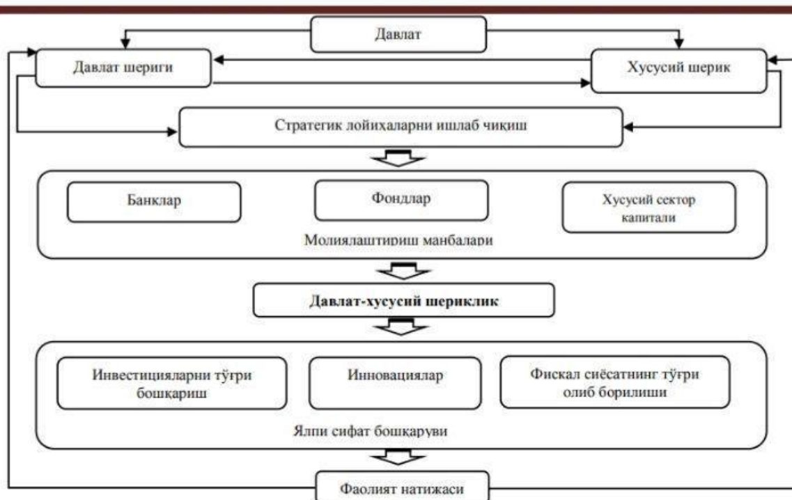
3-расм. Таълим соҳасида давлат-хусусий шериклик механизми