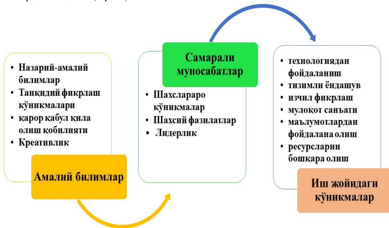
2-расм. Ишга лаёқатлилиқ 3

Таълим доимо эртанги кун билан яшаши лозимлигини эътиборда тутсак, бу борада қилиниши лозим бўлган ишлар кўлами ниҳоятда кўплиги сезилади. Бундан келиб чиқиб, олиб борилган изланишларимиз натижасида ишга лаёқатлилиқ тизимини таклиф қилмоқчимиз (2-расм).