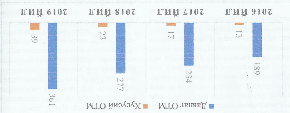
2-расм: "QS BRICS University Rankings" рейтинг кўрсаткичларида давлат ва хусусий ОТМлар сонининг (донада) йиллар кесимида ўсиш кўрсаткичлари

Таъкикотларимиздан маълум бўлдики, рейтингга қатнашувчи ОТМлар йиллар кеси-мида ортиб борган. Айниқса, давлат ОТМлар сони 2016 йилдаги ҳолатидан 2019 йилда қарийб икки баробарга ошган. Худди шундай