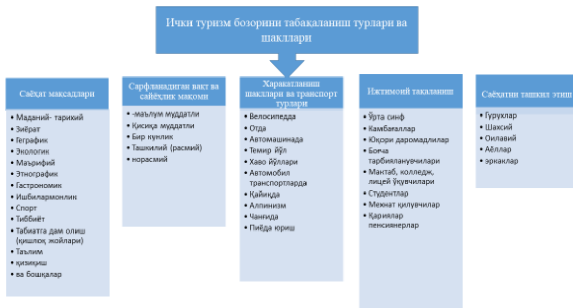
2- чизма. Ўзбекистонда ички туризм бозорини табақаланиш тизими 1

Расмий маълумотларга кўра (“Туризм тўғрисидаги” Ўзбекистон Республикаси қонуни) туризм ташкил этилаётган турнинг ўзига хослиги, мавзуси, давомийлиги, ҳаракатланиш усуллари ва турнинг бошқа хусусиятларидан келиб чиққан ҳолда маданий-тарихий, зиёрат, экологик, маърифий, этнографик, гастрономик, ишбилармонлик, ижтимоий, спорт, тиббий, ёшлар туризми, агротуризм ҳамда туризмнинг бошқа турларига бўлиниши мумкин.