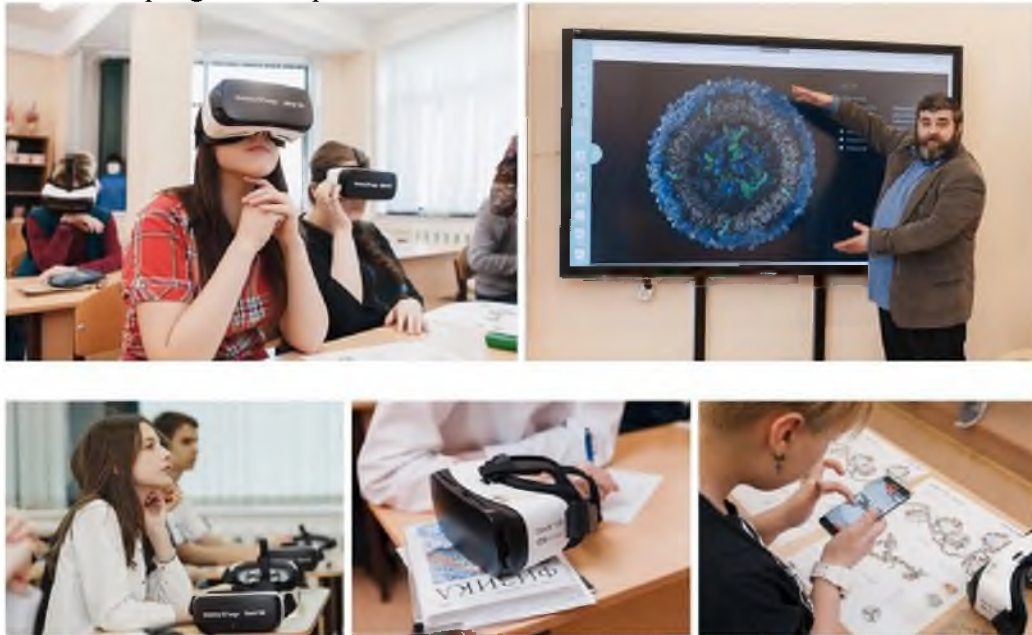
TA'LIMDA MODERN VIRTUAL TA'LIMTEXNOLOGIYALARI

Sizni virtual ta'lim bugungi kunda ta'lim sohasida qanday qo'llanilishini va nima uchun bu texnologiya kelajak mahsuloti ekanligini, shuningdek uning istiqbollari haqida batafsil ko'rib chiqishga taklif qilamiz.