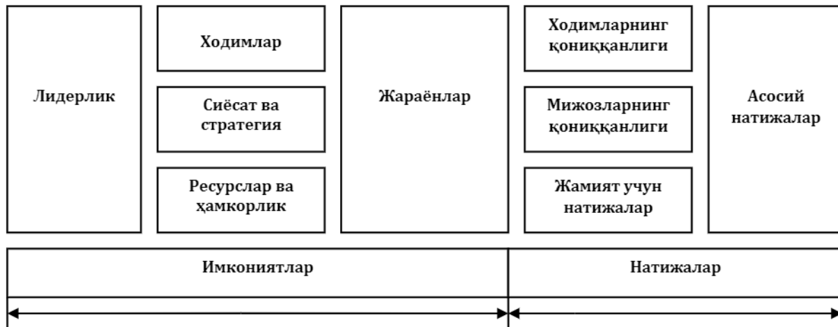
2-расм. Европа Сифат Менежменти Фонди (EFQM)нинг Бизнес маҳорати (Business excellence) модели

Биринчидан, EFQM Бизнес мукамаллик модели тузилиш жиҳатдан тизимли ёндашувга асосланади. Модель иккита тизимости: 1) имкониятлар ва 2) натижалардан таркиб топган ва бир-бири билан чамбарчас боғланган 9 та йирик мезонлардан иборат бўлиб, ҳар бири ўз навбатида бир нечта кичик мезонларга бўлинади.