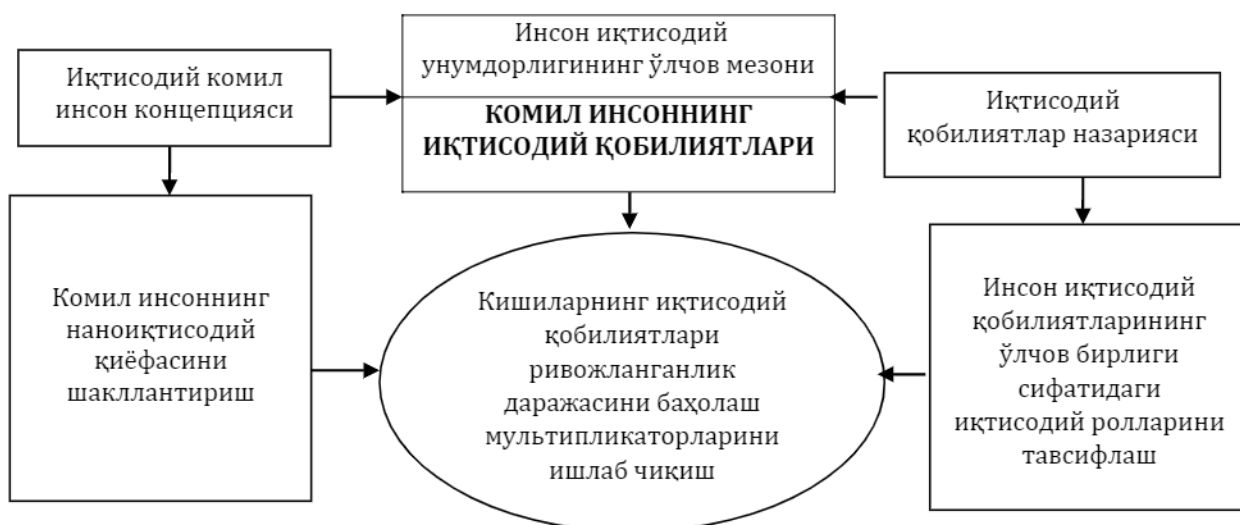
3-расм. Инсон унумдорлигининг “иқтисодий қобилиятлар” концепцияси методологик асослари[13]

Бозор иқтисодиёти тизимида қўшимча қиймат келтирадиган “капитал” тушунчасининг фойда келтирадиган иш – “бизнес” тушунчасига трансформацияси ҳамда менежмент ва маркетинг назарияларининг вужудга келиши ва ривожланиши натижасида “тадбиркорлик қобилияти”ни ишлаб чиқаришнинг шахсий-инсоний омили сифатида шаклланиши ва унинг “ишчи кучи”дан ажралиб, ўзига хос ишлаб чиқариш омилига айланишини илмий жиҳатдан асослаган ҳолда [11, 147-152 б.], проф. Б.Н.Наврўззода томонидан инсон иқтисодий камол топишининг тўртта қуйидаги каби босқичлари ажратилиб, уларга аниқ тавсиф берилган [12, 34 б.].