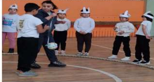
5-rasm. O'qituvchi o'yinda yo'l qo'yilgan kamchiliklardan ogohlantiryapti

Quyov bo'lib qatnashayotgan o'yinchilarga bir oyoqda yugurish va sakrash man etiladi. Onaboshi (qorovul) poliz va katta aylana ichidagina o'yinchilarga ko'ptokni tegizishi mumkin. O'yinchilarni qo'li bilan ovlashi mumkin emas. O'yinni boshqarayotgan o'quvchi bunday hollarni sezganda o'qituvchiga murojaat qiladi. Ushbu metodologiya o'quvchilarning axborotni tanqidiy baholash ( kritik yondashuv ), o'z fikri va mulohazalarini shakllantirish ko'nikmalarini rivojlantirishni o'z ichiga oladi. O'quvchilar muammolarga tahliliy nuqtaviy nazardan yondashishni o'rganadi va mantiqiy fikrlash asosida o'z nuqtayi nazarini shakllantiradi.