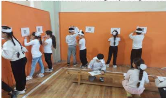
6-rasm. O'quvchilar quyov va tovushqon haqida ma'lumotlar yozishyapti

Guruhning qolgan o'quvchilarini ham 2 guruhga ajratdik. Ularning bir qismiga quyov rasmi tushirilgan, ikkinchi kichik guruhga tovushqon rasmi tushirilgan qo'g'ozlar tarqatiladi ( 6-rasm ). O'quvchilar chaqqonlik bilan har ikkala hayvonga tavsif beradi, ularning tabiatdagi va inson hayotidagi roli, ular iste'mol qiladigan mahsulotlarni yozadi va javoblarini izohlab beradi. Bunday topshiriqni bajarish ham o'quvchilarda 4K elementlarining rivojlanishiga olib keladi ( 6-rasm ).