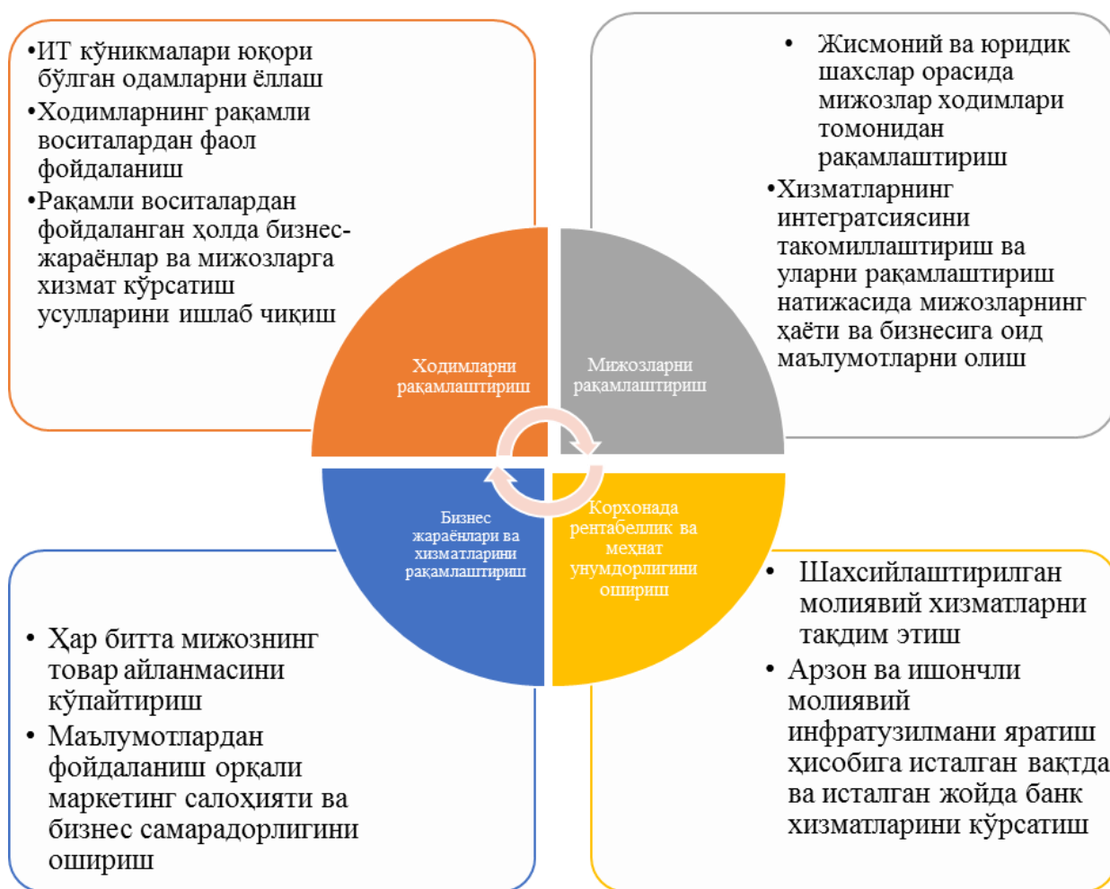
2-расм. Кичик бизнес учун рақамли трансформация циклини яратиш механизми тавсифи 4

Лойиҳани етказиб бериш усулларини ислоҳ қилишда анъанавий ёндашув - тадқиқот натижаларини ва мунозараларни масъул бўлимда иш даражасида бирлаштириш орқали олиб борилади бу эса жуда ҳам самарасиз усул ҳисобланади. Янгича ёндашувларга кўра, лойиҳани етказиб бериш келгусида циклини асосий тадқиқотлар ва мунозаралардан ёки прототип билан тажриба ўтказилишидан эффектни тасдиқлаш орқали амалга оширилади. Иш даражаси билан яқин алоқада бўлиш бўлиш ва ҳолис баҳони олиш, иш сифатини яхшилаш, янги хизматларни кўрсатиш тўғрисида қарорни менежерлар зиммасига юклатилади.