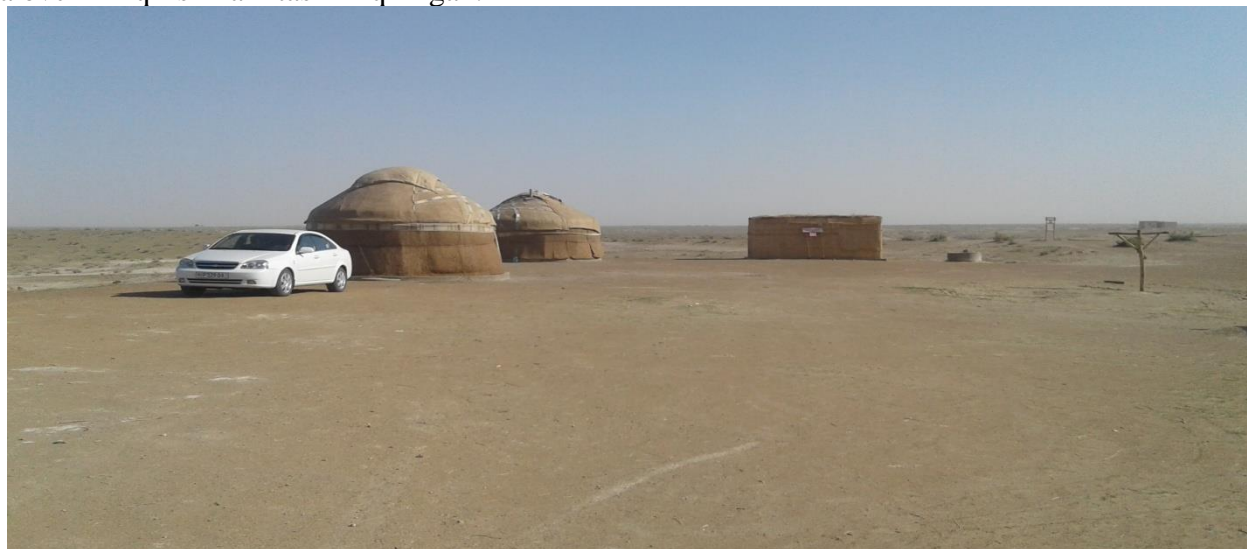
3-rasm. Zamonbobo ko'li bo'yidagi kichik turistik zona

Ma'lumki viloyatimizda turizm sohasi ancha rivojlangan bo'lib, bu sohada juda ko'plab ishlar amalga oshirilmoqda. Jumladan suv bo'yi turizmini alohida aytshimiz mumkin, viloyatimizda mavjud suv havzalarida sohil bo'yi turizmi tashkil etilmoqda. Qorako'l tumanidagi suv havzalaridan oqilona foydalanish maqsadida mavjud suv havzalari bo'yida kichik dam olish maskanlari tashkil etilmoqda. Shunday hududlar sirasiga Qorako'l tumanida joylashgan Zamonbobo ko'li bo'yida insonlar dam olishi maqsadida kichik dam olish maskani tashkil etilgan. U yerda dam oluvchilar uchun qora uylar tashkillashtirilgan. Bundan tashqari ko'lda ovchilik qilish ham tashkil qilingan.