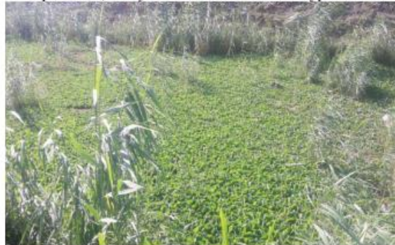
2-расм. Паррандачилик корхонаси оқова сувларини биологик ҳовузларда пистия ўсимлиги ёрдамида тозалаш