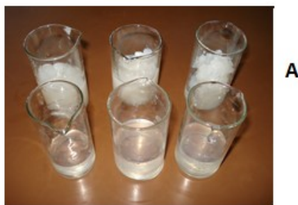
Рис.2. Охлажденные гидрогели клейстеров нативного (а) и окисленного (б) крахмала (соответственно из 5, 6, 7 % ных клейстеров) рисовой муки

Эксперименты проводимые относительно функциональных свойств окисленного нами крахмала полученной из рисовой муки указали некоторые подобия кукурузными или пшеничными крахмалами. Предельно-допустимая концентрация при формировании геля для нативного крахмала оказалось 5 % (m/v) но для окисленного крахмала 7 % (m/v) и влияние концентрации в этом процессе показаны на ниже представленном рисунке 2.