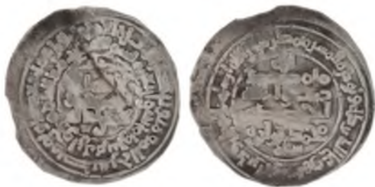
Shvetsiyadan topilgan Ahmad ibn Muhammadning kumush tangasi. Shvetsiya tarix muzeyi. SMH 16184

nafar hukmdori safiga kiritmagan [4:33]. Taxminimizcha, Abdulloh taxtni o'zboshimchalik bilan egallab, Somoniylar hokimiyatiga qarshi chiqqan. Keyinroq, Nuh ibn Nasr unga qarshi qo'shin yuborgach, u qochib ketadi. Uning o'rniga esa Somoniylar poytaxtida garov sifatida ushlab turilgan Muhammadning o'g'li Abu Said Ahmad Xorazmshoh sifatida qo'yiladi. Ahmad ibn Muhammadning taxtga o'tirgan yili to'g'risida ham aniq ma'lumot yo'q. Lekin, Abu Rayhon Beruniy "Osor ul-boqiya" asarida u taxtga o'tirgach Xorazmning mahalliy Ajg'ar (inglizcha matnda - Ajghar) nomli bayramini iyul oyi o'rtasiga to'g'irlash uchun Xorazm taqvimini isloh qilgan, deb ma'lumotlar bergan. Bu voqea Beruniyning aytishicha, Aleksandr vafotidan 1270 yil keyin ya'ni, 959-yilda sodir bo'lgani va bu masala haqida Ahmad 7 yil oldin, ya'ni Buxorodan qaytgan payti o'ylay boshlagani haqida yozgan [5:229-230]. Bundan kelib chiqadiki, Abu Said Ahmad taxtga 952-yil o'tirgan. Lekin, bu hukmdor o'z ajdodlaridan farqli jihati shundaki, uning tangalarida hukmdor tangalarda aynan "Xorazmshoh" unvoni bilan qayd qilingan. Shu asosda bu davrda Xorazm Somoniylar ta'siridan mustaqil tarzda faoliyat yuritgan, degan fikrga kelishimiz mumkin.