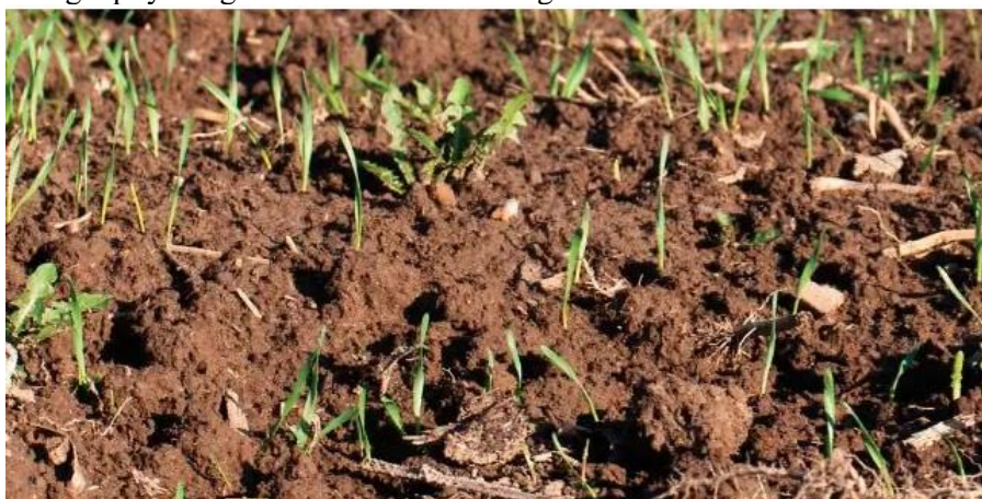
Yerni qayta ishlash

Tuproq qatlamiga ishlov berish almashlab ekish jarayonlarining asosiy stimulyatori hisoblanadi. To'g'ri ishlab chiqilgan o'stirish tizimi, xususan, erning namlik bilan ta'minlanishi va aeratsiyasini yaxshilaydi, shuningdek, foydali mikroorganizmlarning faollashishiga yordam beradi. Tuproqni o'stirishning zamonaviy usullari an'anaviy tuproq ishlov berish elementlarini va yangi texnologiyalarni o'zida mujassam etgan, ammo har bir holatda ulardan foydalanishda tashqi mikroiklim sharoitlari va o'ziga xos o'simliklarga qo'yiladigan talablarni ham hisobga olish kerak.