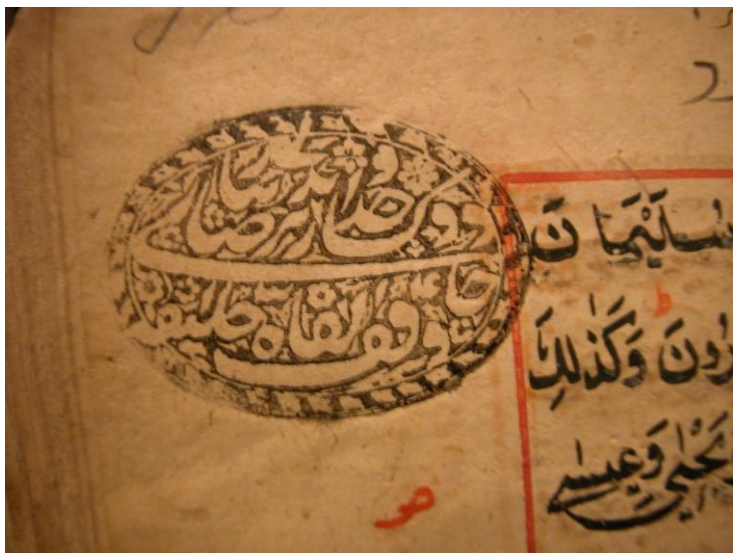
Иллюстрация № 1