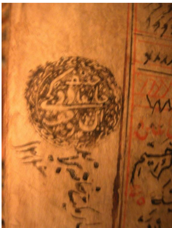
Иллюстрация № 2

Как видно из таблицы, только часть книг удалось выявить. Есть надежда в том, что большая часть книг пережила испытание времени. Их поиски продолжаются.