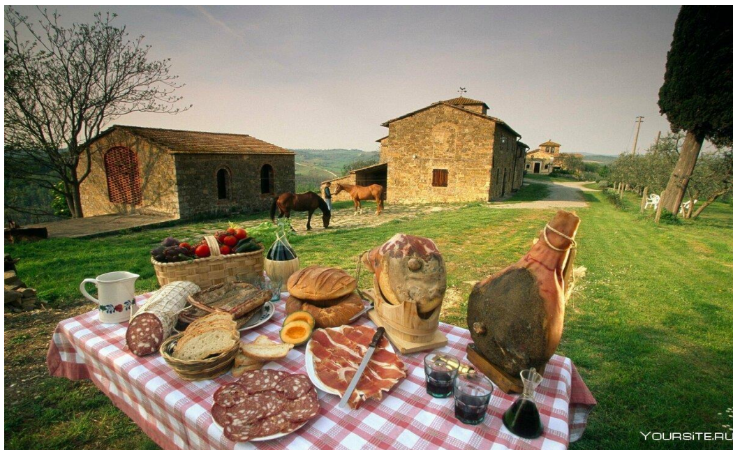
Рис.3.Экотуризм в Италии

Итальянская модель делится на три основных направления по специфике предоставления услуг. Это совмещения типичного отдыха в сельской местности с восстановлением здоровья (экотуризм), изучением гастрономии и продуктов местного производства, которые отличаются ввиду их территориальной расположенности, а также занятия спортом. Размещение туристов происходит в апартаментах и комнатах. Иногда встречаются палаточные городки. (Рис.3.Экотуризм в Италии)