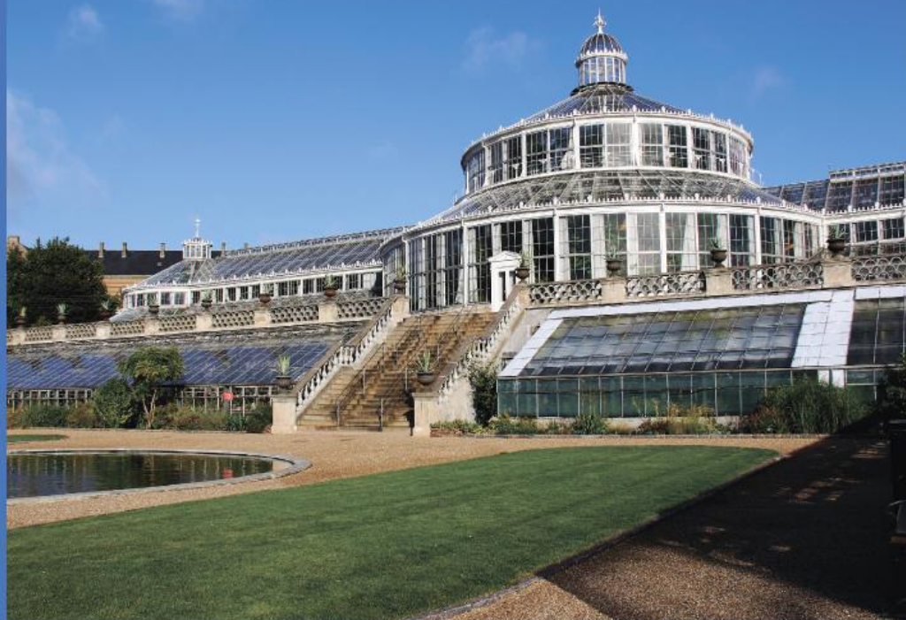
КОПЕНГАГЕНСКИЙ УНИВЕРСИТЕТ (ДАНИЯ). ОСНОВАН В 1479 ГОДУ

НАУЧНО-МЕТОДИЧЕСКИЙ ЖУРНАЛ «ACADEMY» №5(56), 2020 ISSN 2412-8236