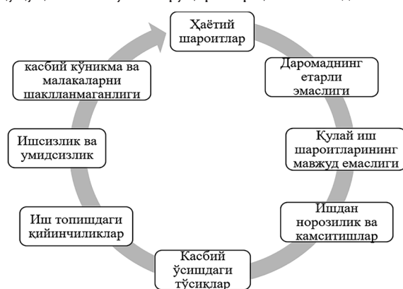
2-чизма. Ўзини ўзи банд қилган шахслар сифатида рўйхатдан ўтишда таъсир этувчи омиллар 5 .

Айниқса, сўнгги вақтларда “ўзини ўзи банд қилиш” атамаси тез-тез тилга олинмоқда. Хўш, аслида улар ким? Ўзини-ўзи банд қилган фуқаролар – меҳнат даромади олишга йўналтирилган жисмоний ва юридик шахсларга хизматлар кўрсатиш, ишларни бажариш бўйича шахсий меҳнати билан иштирок этишга асосланган фаолиятни мустақил амалга оширадиган, яқка тартибдаги тадбиркор сифатида рўйхатга олинмаган ва ўз фаолиятида ёлланма ходимлар меҳнатидан фойдаланмайдиган жисмоний шахслар меҳнат стажини ҳисобга олиш ва рағбатлантирувчи имтиёзлардан фойдаланиш ҳуқуқига эга бўлган фуқаролар ҳисобланади.