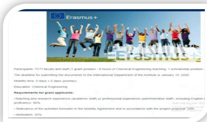
Fig.1. Announcement on institute website (tkti.uz) about the Call for participation in the mobility program. TCTI. September, 2019 y.

After we received confirmation from University of Cantabria, we begin to prepare the most important document for all academic mobility participants - Learning Agreement . We try to choose study plan at the University of Cantabria so that upon returning to Uzbekistan the grades in the necessary disciplines would be counted. As a result, a Mobility Agreement was prepared and signed indicating academic disciplines that I can study at the University of Cantabria. The disciplines of Life cycle assessment, Advanced separation processes, Wastewater treatment were selected.