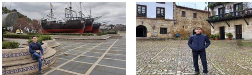
Fig.3. Sightseeing at Santander, Cantabria, Spain. 30.01.2020 y.

Europe. Mobility program Erasmus+ created so many chances and opportunities for students who study at Universities from different countries. Best of all is that, in this program could participate students and teachers not only from European Universities, it gives great opportunities to students and staff from all Universities around the world.