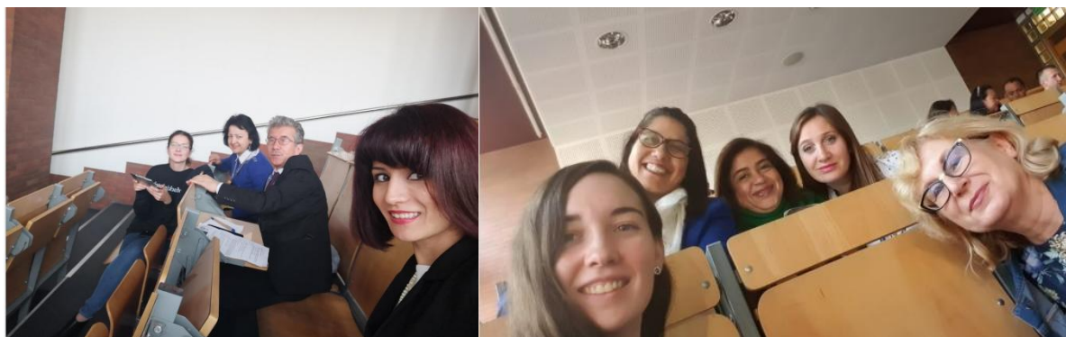
Workshop on COIL course design, Gliwice, 25.10.2019 y. 3

Cooperating instructors work closely with all students, but in most cases these students are enrolled only at their home institution. This revenue-neutral model reduces the administrative complexity of bilateral institutional agreements, while enhancing international classrooms through collaborative coursework. These courses do not require high-end technology, and they work effectively as portals to increase student interest in study abroad 4 .