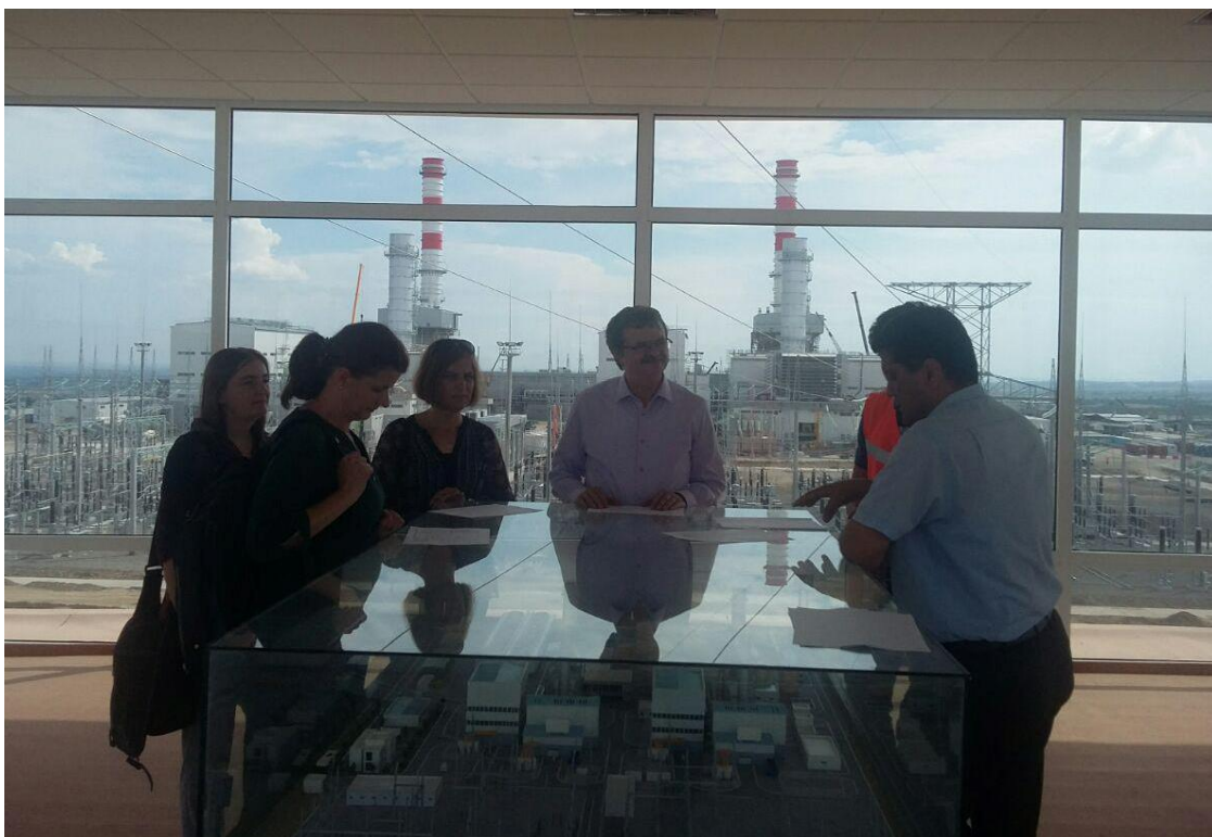
Руминиялик профессор-ўқитувчилар Наманган вилояти Тўрақўрғон иссиқлик электр станцияси билан танишмоқдалар, 2019 йил 2 июнь

Бундан ташқари меҳмонлар НамДУ вакиллари билан истиқболли режалар тузиб олишда ва “Атроф муҳит муҳофазаси ва кимё фанлари ўқув дастурларини бенчмаркинг методи асосида такомиллаштириш” мавзусида халқаро лойиҳа бошлашга келишиб олинди. Шу билан бирга илмий тадқиқотчилар, талабалар ва профессор-ўқитувчиларни алмашинувини йўлга қўйишга қаратилган ўзаро шартнома имзоланди. Меҳмонлар Наманган вилоятининг иқтисодий имкониятларни кўрсатувчи муҳим объектлар билан таништирилди, жумладан Тўрақўрғон иссиқлик электр станциясида бўлишди.