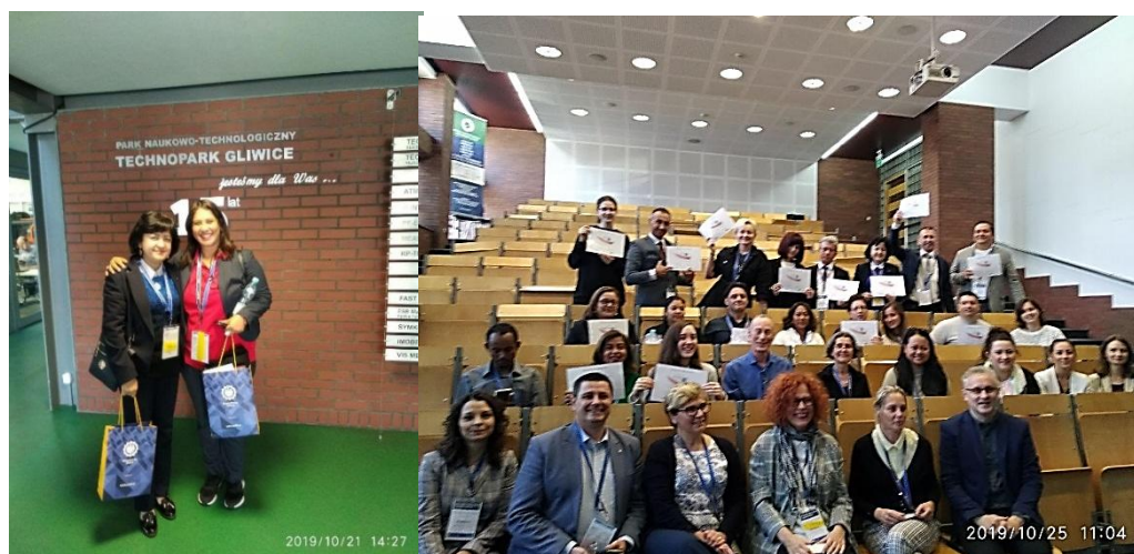
Participants of International Staff Week at SUT, Gliwice, 21-25.10.2019 y.

The participants of the International Staff Training Week not only listened to interesting lectures, but were also able to work in small groups, testing and evaluating various online telecollaboration tools 2 .