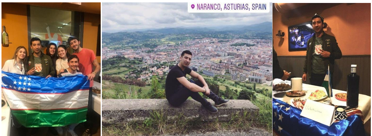
Fig.1. With friends (left) and Sightseeing place in Oviedo (right), Spain

My Erasmus+ program was the period full of emotions, time to exchange knowledge, making new friends through the world, spending great time, chance to see a lot of EU countries and cities, meeting many new traditions, creating histories and collecting plenty of data and memories.