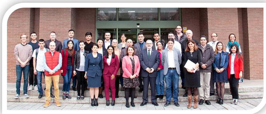
Fig. 1. Participants of Staff Week at University of Cantabria, March 11-15, 2019.