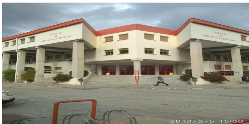
Granada university "Facultad de ciencias de la educacion"

During the period from February to June 2018, I studied with international students at the University of Granada 6 in Spain under the Erasmus + exchange program of European Union. I improved my knowledge and skills in the subjects selected on a contract basis and approved by both institutes, and had a wide-ranging discussion with my peers studying at foreign universities on the subject and shared their worldview.