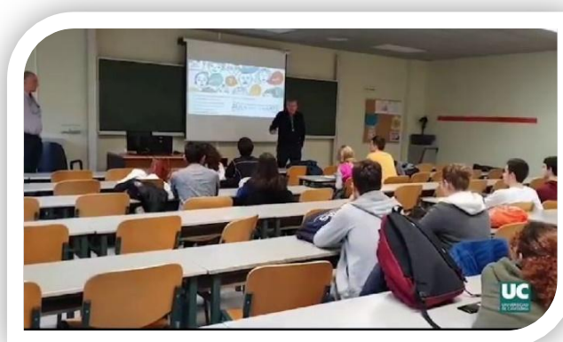
Fig. 4. At the Escuela Técnica Superior de Ingenieros Industriales y de Telecomunicación, University of Cantabria. 3.02.2020 y.

Students at Spain Universities are not required to attend all lessons , but many of them get good grades on the exam. During lessons teachers use developed methods of teaching, nearly everything is on computers and have online resources for study.