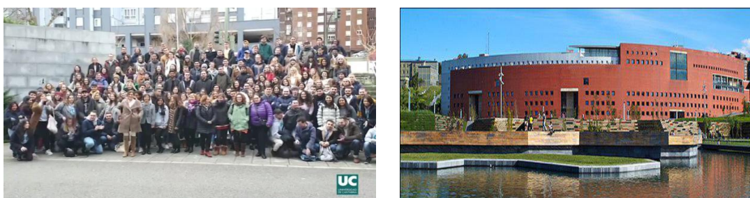
Fig. 2. “Welcoming program” International relations office at the University of Cantabria. 19.01.2020 y.

When I arrived to Santander we had a “Welcoming program” which was very useful, interesting and exciting for all students. We were introduced the city, visited places of interest, museums etc.