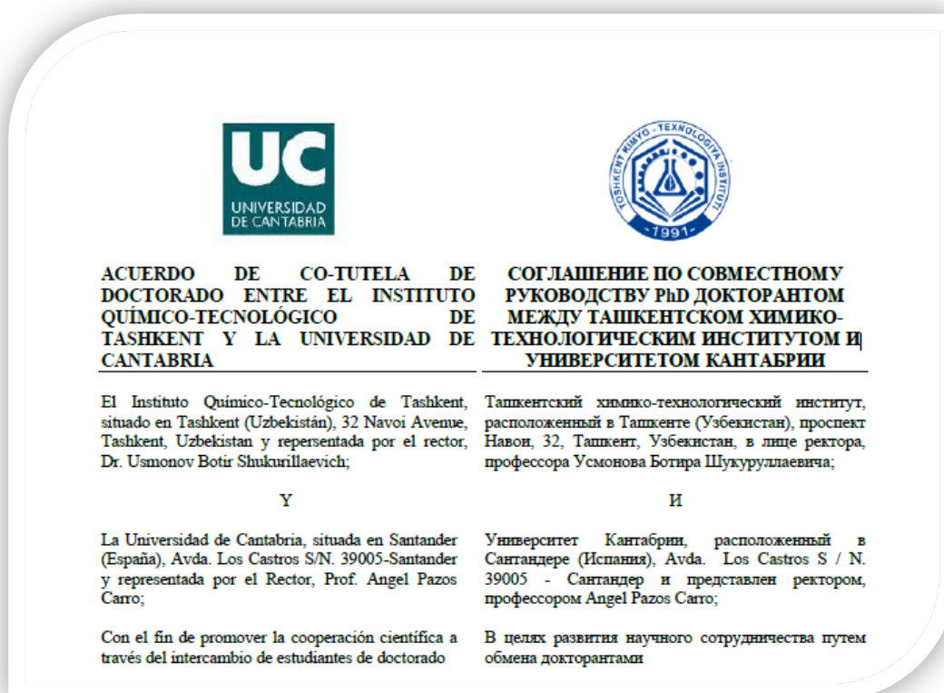
Fig.2. Cotutelle Agreement between Tashkent chemical – technological institute and University of Cantabria. January, 2020.

Advantage of the Cotutelle programs for PhD doctorates lies in the possibility of being able to write a dissertation within an international context, work with international research group in leading universities around the world. Besides this the doctoral candidate is also given a unique chance of practicing and improving language skills, gaining intercultural competence, familiarizing with the research culture and environment of the host country, all this lays for foundation of future international career network.