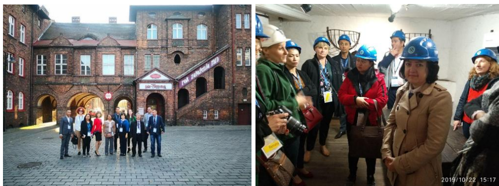
Participants of Staff Week at cultural trip to Coil mine, Gliwice, 22.10.2019 y.

As a result, the development of online education contributes to the development of new types of education, to which COIL education can rightfully be attributed. I believe that the development of COIL courses in Uzbekistan has great potential, because in all COIL course projects, course goals remain focused on student-to-student interaction and the opportunity to learn together with those who have perspectives different from our own. Hereby virtual exchanges are complex, often blended learning environments in which students can develop a range of skills and competencies which are indispensable for their future professional fields.