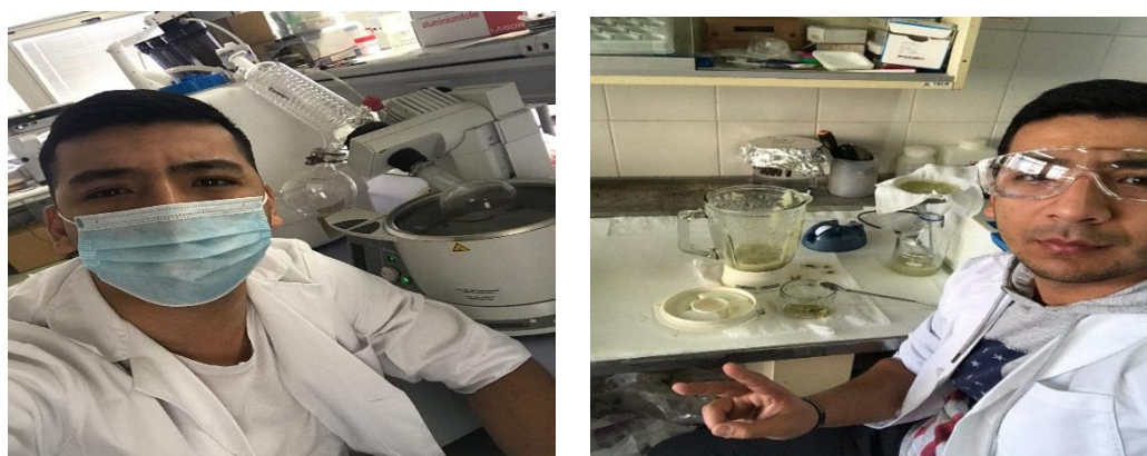
Fig. 3. At the Laboratory. University of Oviedo, Spain.

Therefore, I want to talk about differences from student point of view. In European universities teachers are not that strict and students do not have to attend all the classes, which mean they won't be punished if they miss classes. Even though they don't have strict rules students do well at all subjects. They study really hard. Most of them usually don't work while studying at University. They look for a job only after graduating from university. I think they concentrate on their studies better than we do. The final grade (ECTS) consists of 20% of the seminar lessons and 80% of the final exam. Surprisingly that students are not required to attend all lessons, but many of them get good grades on the exam.