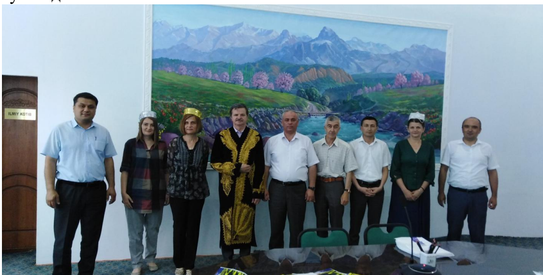
Руминиялик профессор-ўқитувчилар Наманган давлат университети вакиллари билан музокаралар ўтказиш вақти, 2019 йил 3 июнь

Бундан ташқари меҳмонлар НамДУ вакиллари билан истиқболли режалар тузиб олишда ва “Атроф муҳит муҳофазаси ва кимё фанлари ўқув дастурларини бенчмаркинг методи асосида такомиллаштириш” мавзусида халқаро лойиҳа бошлашга келишиб олинди. Шу билан бирга илмий тадқиқотчилар, талабалар ва профессор-ўқитувчиларни алмашинувини йўлга қўйишга қаратилган ўзаро шартнома имзоланди. Меҳмонлар Наманган вилоятининг иқтисодий имкониятларни кўрсатувчи муҳим объектлар билан таништирилди, жумладан Тўрақўрғон иссиқлик электр станциясида бўлишди.