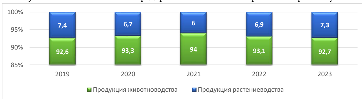
Рисунок 2. Продукция сельского хозяйства.

Следует отметить, что наибольшее количество предприятий и организаций наблюдалось в Кашкадарьинской области – 7 098 единиц, или 16,9 % от общего количества предприятий и организаций, осуществляющих деятельность в данной отрасли республики, тогда как наименьшее количество предприятий и организаций зафиксировано в городе Ташкент - 685 единиц (1,6 %). К сожалению не все предприятия используют маркетинг и маркетинговые исследования как инструмент продвижения своего товара на рынок. Зачастую сельскохозяйственные предприятия не относятся серьезно к маркетингу.