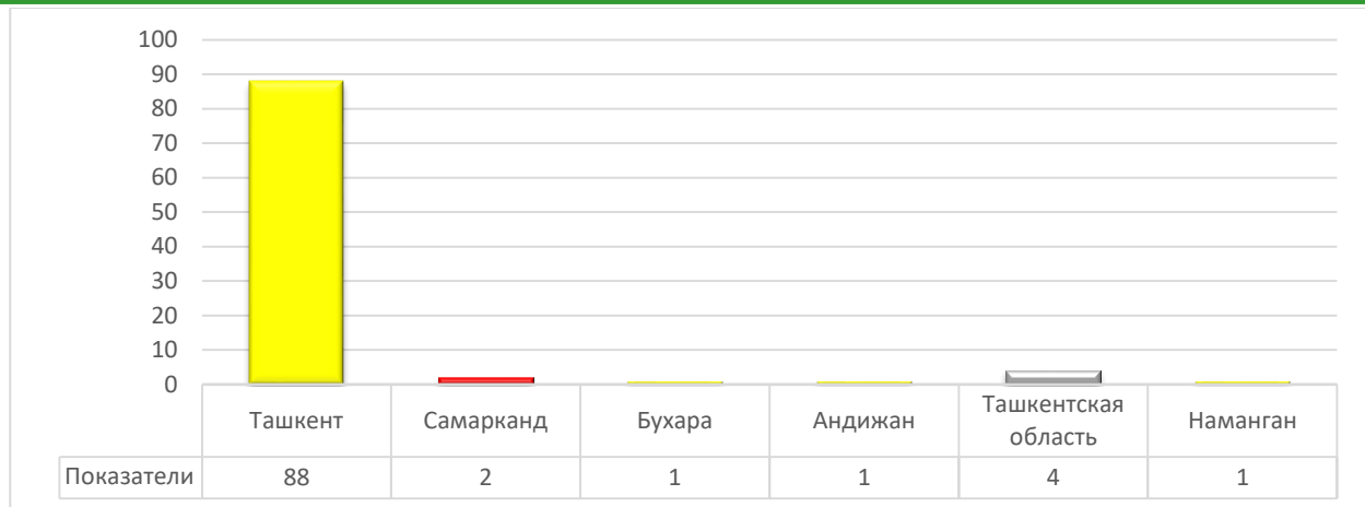
Рисунок 4. Маркетинг - услуги в Узбекистане

Предоставленные данные позволяют провести анализ сферы маркетинговых услуг в Узбекистане с акцентом на географическое распределение.