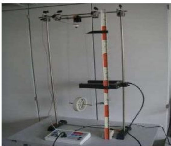
Рис. 2. Колесо в стартовом положении помощью колеса Максвелла