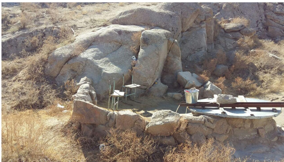
Фото 6. Колодец на Бедер ата