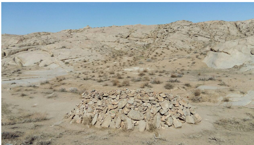
Фото 7. Захоронение смотрителя комплекса Бедер ата