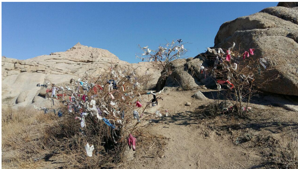
Фото 5. Кустарники с завязанными лоскутами ткани. Бедер ата