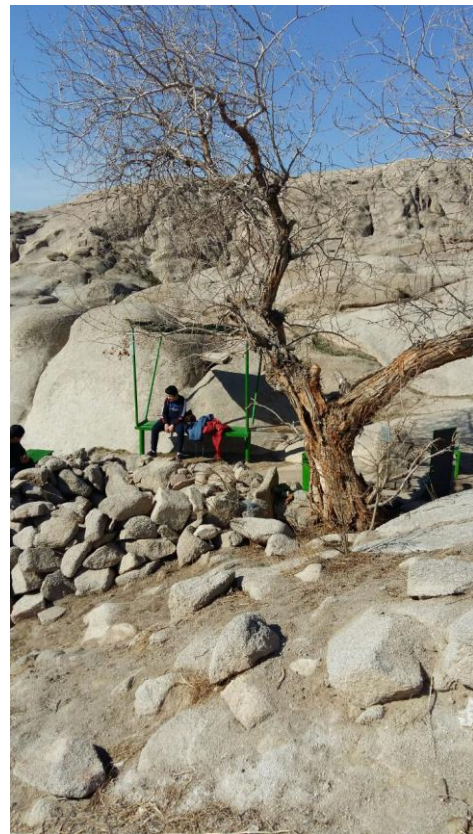
Фото 4. Общий вид захоронения Бедер ата