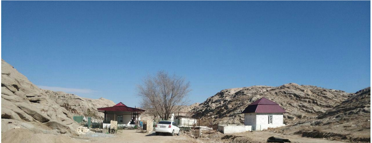
Фото 1. Общий вид входа в ущелье и построек святого места Бедер ата.