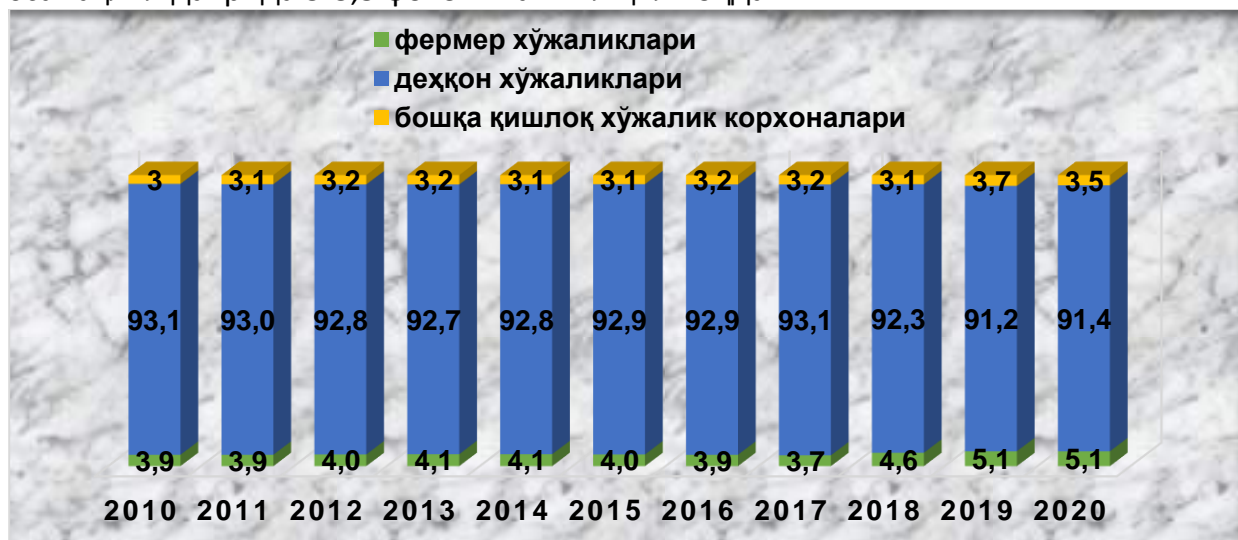
2-расм. Хўжалик шакллари бўйича чорвачилик маҳсулотлари етиштиришнинг улуши, фоизда

Чорвачилик маҳсулотлари етиштиришда деҳқон хўжаликларини улуши юқори бўлиб, 2010-2020 йиллар орасида 93-91 фоизни ташкил қилмоқда. Фермер хўжаликларининг чорвачилик маҳсулотлари етиштиришдаги улуши 2010-2020 йилларда 3,9-5,1 фоизни, ўсиш даражаси эса 30 фоизни ташкил қилмоқда. Бошқа қишлоқ хўжалиги корхоналарининг чорвачилик маҳсулотлари етиштиришдаги улуши эса таҳлил даврида 3-3,5 фоизни ташкил қилмоқда.