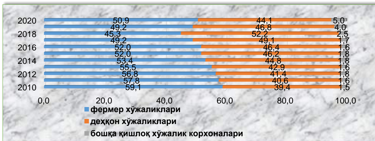
1-расм. Хўжалик шакллари бўйича деҳқончилик маҳсулотлари етиштиришнинг улуши, фоизда