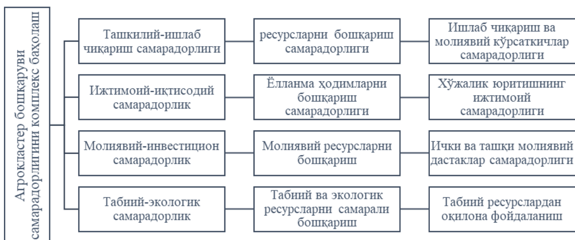
1-расм. Агрокластер бошқаруви самарадорлигини комплекс баҳолаш услубиёти 4

Юқоридагиларни инобатга олган ҳолда, мамлакатимизда агрокластер бошқаруви самарадорлигини баҳолашнинг миллий услубиётини ишлаб чиқиш зарур, деган хулосага келинди. Бунда мамлакатимиз қишлоқ хўжалиги ва ушбу соҳани ривожлантириш бўйича давлат томонидан амалга оширилаётган ислохотларнинг устувор йўналишларига асосланиш талаб этилади. Ушбу вазиятни инобатга олган ҳолда, агрокластер бошқаруви самарадорлигини комплекс баҳолаш услубиётини шакллантирдик (1-расмга қаранг).