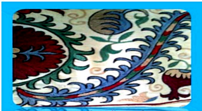
Buxoro. Soʻzaning qisqa koʻrinishi

Soʻzanalarning qadimgi namunalari saqlanmagan. Muzey va shaxsiy kolleksiyalardagi, asosan, XIX asrga mansub Nurota, Buxoro, Samarqand, Shahrisabz, Oʻratepa, Toshkent, Fargʻona va boshqa joylarda tayyorlangan soʻzanalar kashtaning oʻziga xos tikish uslublari bilan sanʼanshunoslar diqqatini tortib kelmoqda. XX asrda, ayniqsa, 40-yillardan keyin soʻzanalar tikish mashinalarda tikila boshladi. Qashqadryo, Buxoro viloyatlarida soʻzanalarni bigiz bilan yoki har turli quroqlardan foydalanib tikadilar. Har bir xonadonda mehmon kutish uchun ishlatiladigan koʻrpa-toʻshaklarni ustini yopish uchun Buxoro, Navoiy viloyatlarida soʻzanalar baxmal, vilyur, satin kabimatolardan astarli qilib tikiladi. Soʻzana atrofi magʻiz yoki jiyak bilan bezatiladi.