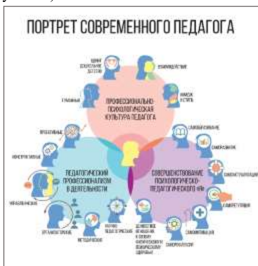
Рисунок 1. Портрет современного педагога

В рамках нашего педагогического исследования мы сделали попытку объединить все профессиональные качества педагога дошкольного образования и представить «Портрет современного педагога» (Рисунок 1.).