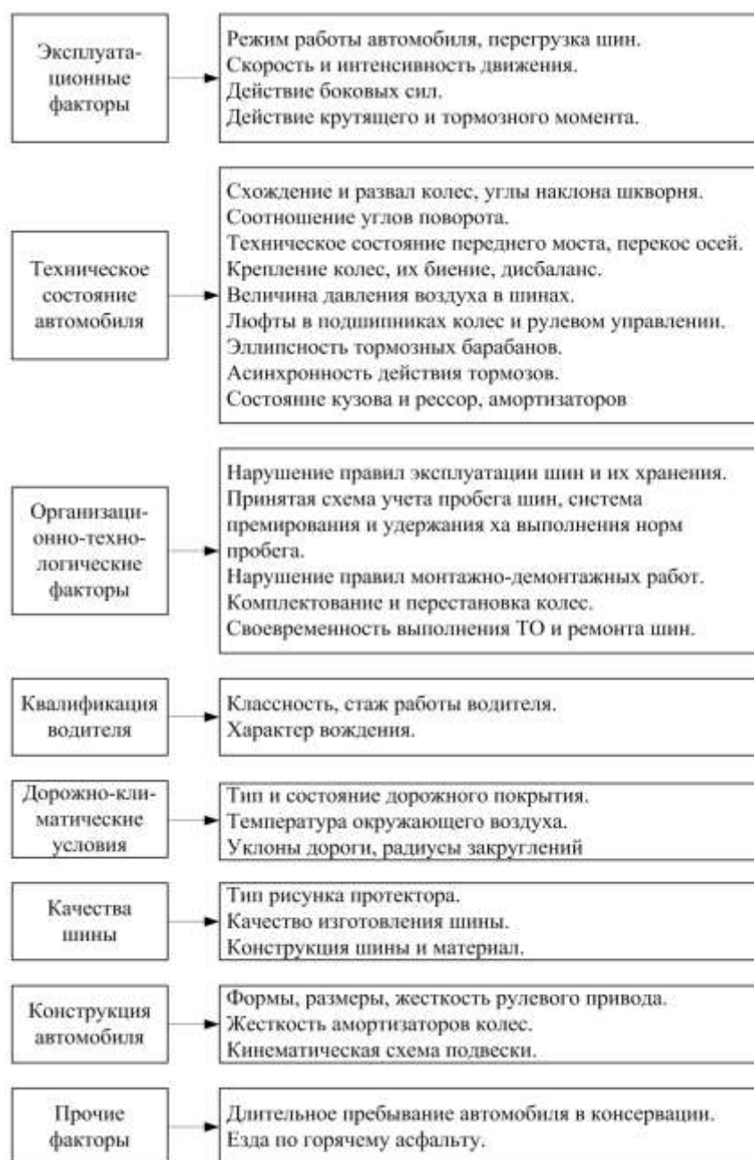
Рисунок 1.2 – Классификация основных факторов, влияющих на ресурс шин

Влияние факторов определяются рядом параметров (рис.2). Отклонение каждого из параметров от оптимального состояния увеличивает интенсивность износа шин. Влияние первой группы факторов может быть полностью устранено совершенствованием работ технической службы предприятия. Влияние второй группы факторов может быть полностью или частично устранен, но не всегда это возможно, влияние третьей группы факторов не может быть устранено, но должно учитываться при установлении или корректировке норм пробега шин.