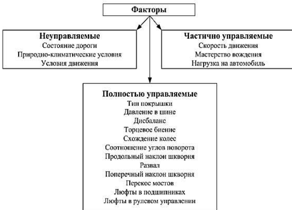
Рис.1. Факторы, влияющие на интенсивность износа шин технической службы.

К ним относятся дорожно-климатические условия, конструкция автомобилей, качество шин.