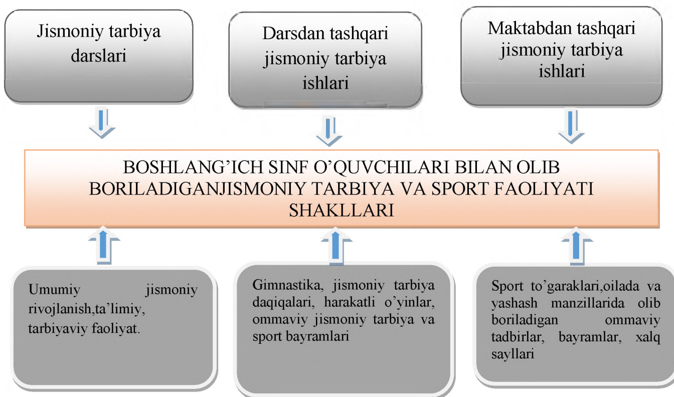
2-rasm. Boshlang'ich sinf o'quvchilarida jismoniy sifatlarni rivojlantirish shakllari

Jismoniy tarbiya darsi umumiy o'rta ta'lim maktablarida o'quvchilar jismoniy tarbiyasining eng asosiysi hisoblanadi. Chunki dars qonun qoidalar asosida o'tkaziladi va