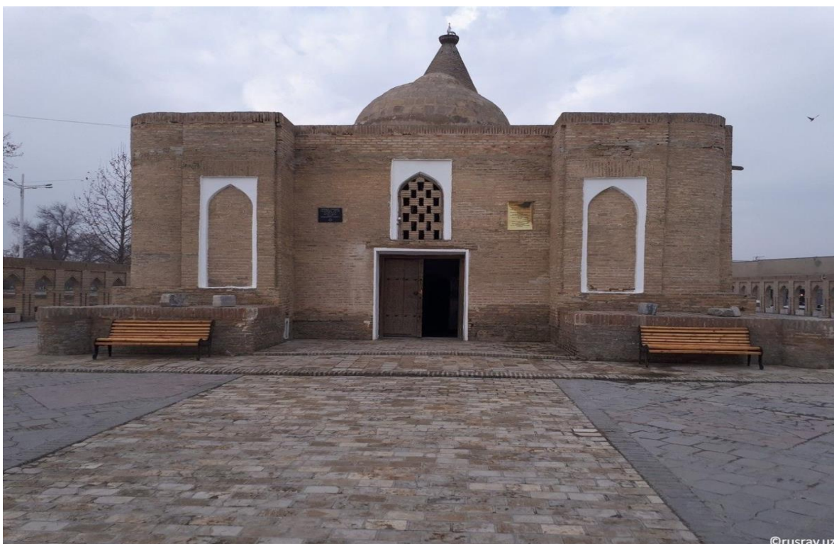
CHASHMAI AYUB MAQBARASI