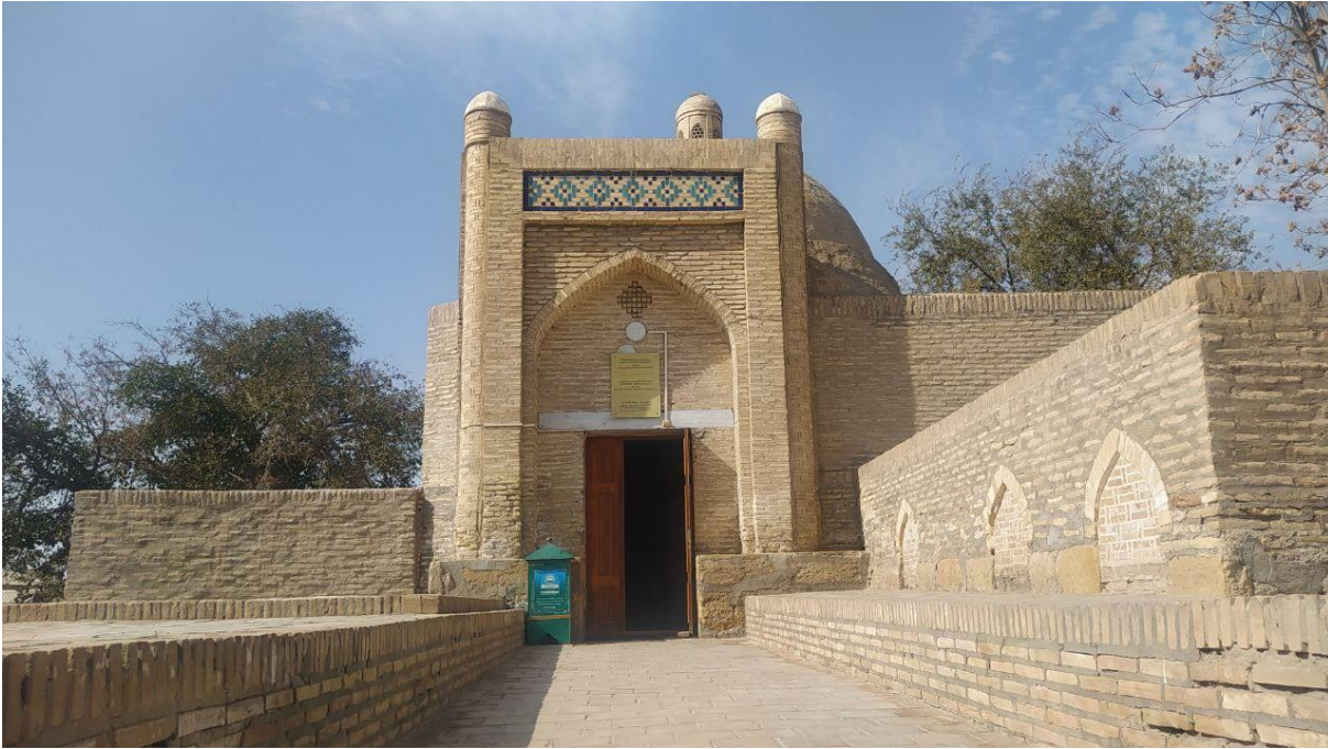
BOBOYI PORADO‘Z MAQBARASI