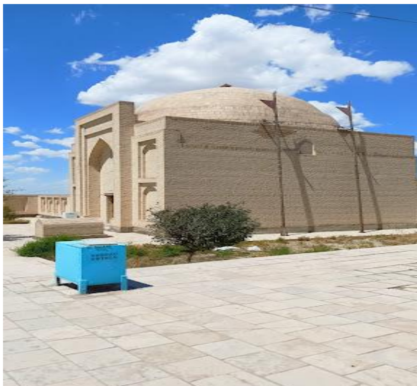
XOJA UBBON MAJMUASI