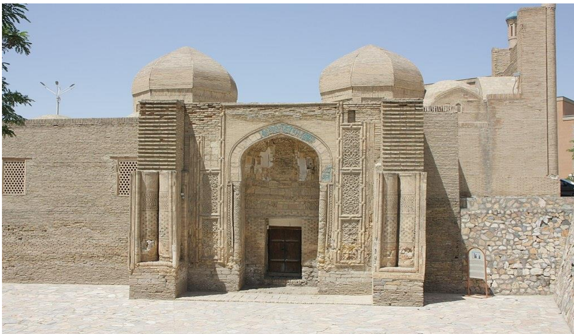
MOG'OKI ATTORI MASJIDI