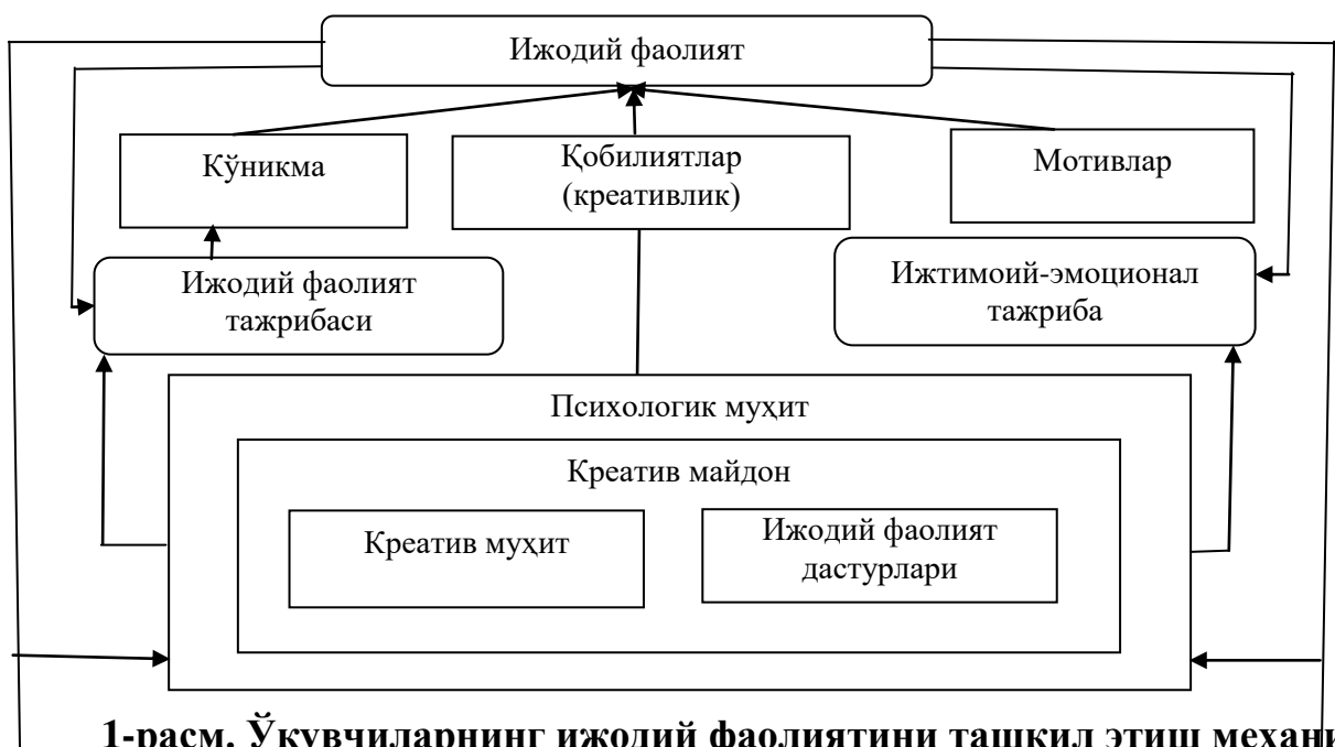
1-расм. Ўқувчиларнинг ижодий фаолиятини ташкил этиш механизми.

Ўқувчиларнинг ижодий фаолиятини ташкил этишнинг қуйидаги механизми таклиф этилди (1-расм).