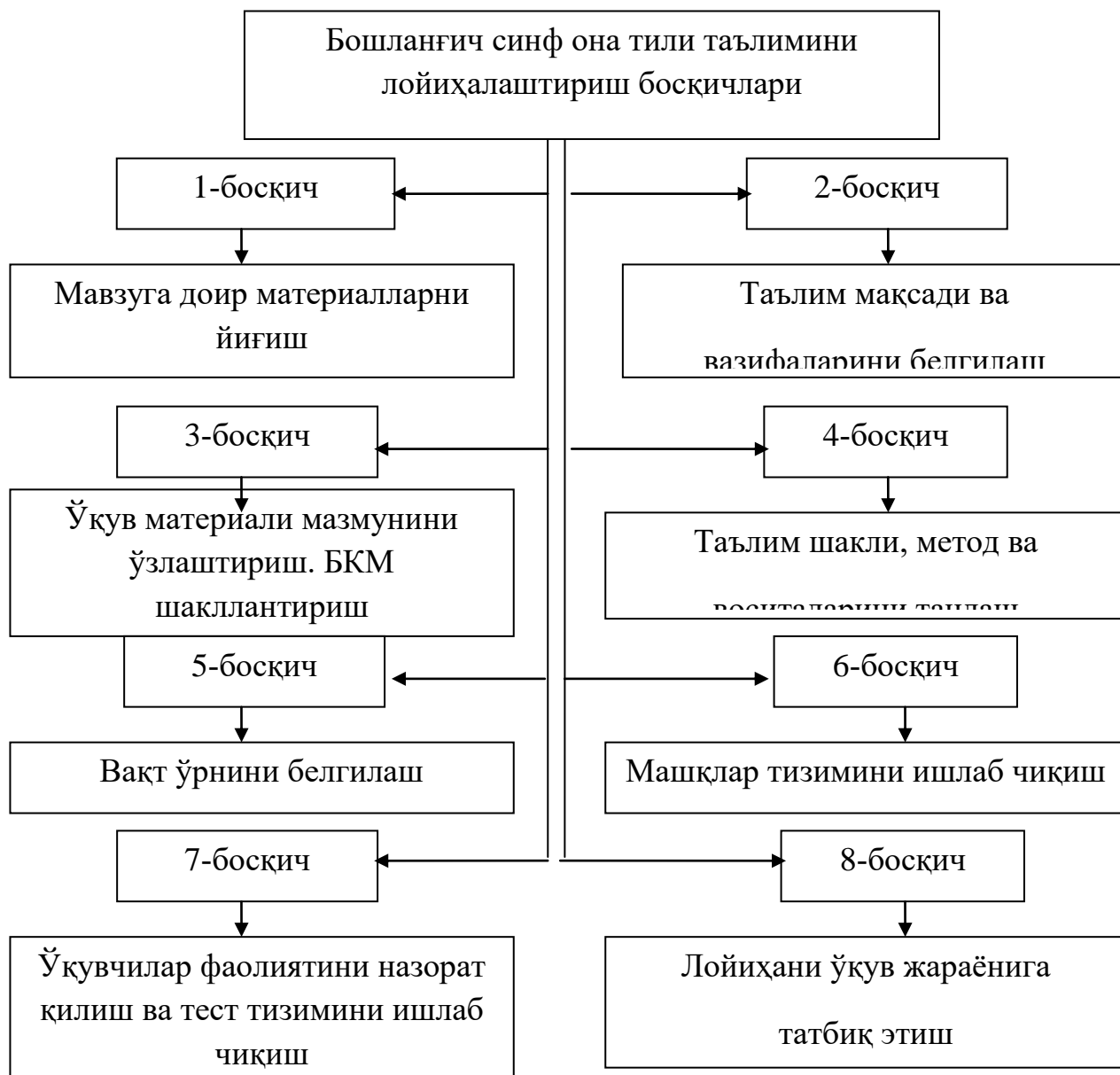
Ўқув жараёнини лойиҳалаш босқичлари

Асосий қисм. Назарий ва амалий жиҳатдан тўғри бўлган тест тизимининг ишлаб чиқилиши таҳсил олувчиларнинг мавзу (фаолият мазмуни) юзасидан муайян тушунчаларни ўзлаштириш, шунингдек, амалий кўникма ва малакаларни шакллантира олганлик даражаларини аниқ ва холис аниқлай олиш имконини беради. Тест тизимини ишлаб чиқишда тестларнинг изчил, узвий ҳамда бир-бири билан уйғун бўлишларига аҳамият бериш мақсадга мувофиқдир.