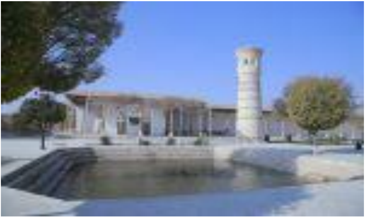
Бобойи Самосий зиёратгоҳи