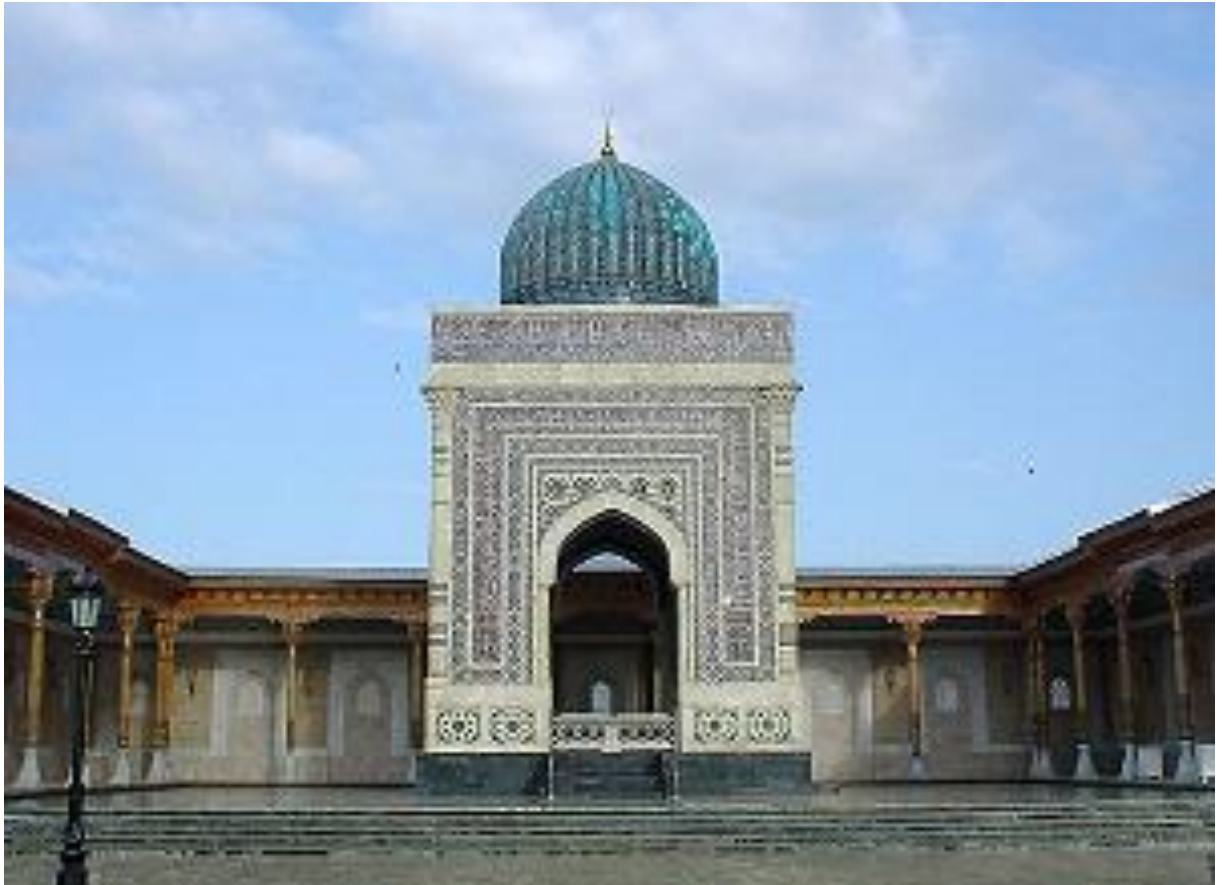
Имом Исмоил ал Бухорий зиёратгоҳи