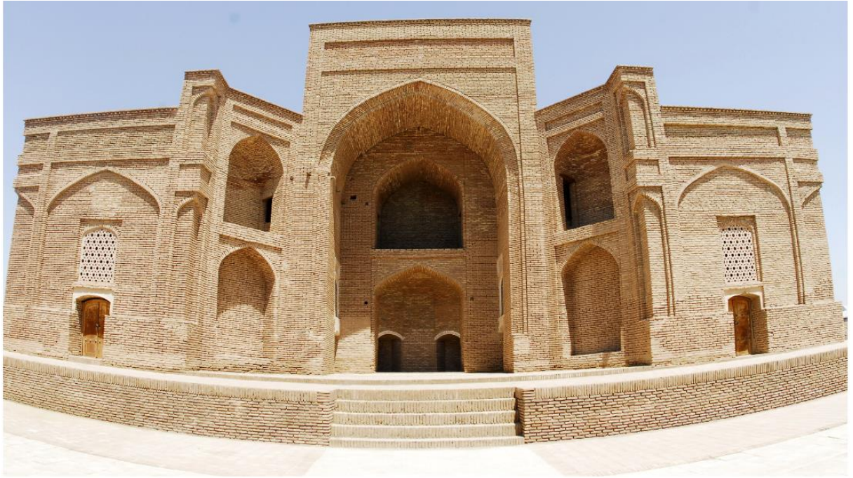
Sulton Saodat majmuasi - Termiz