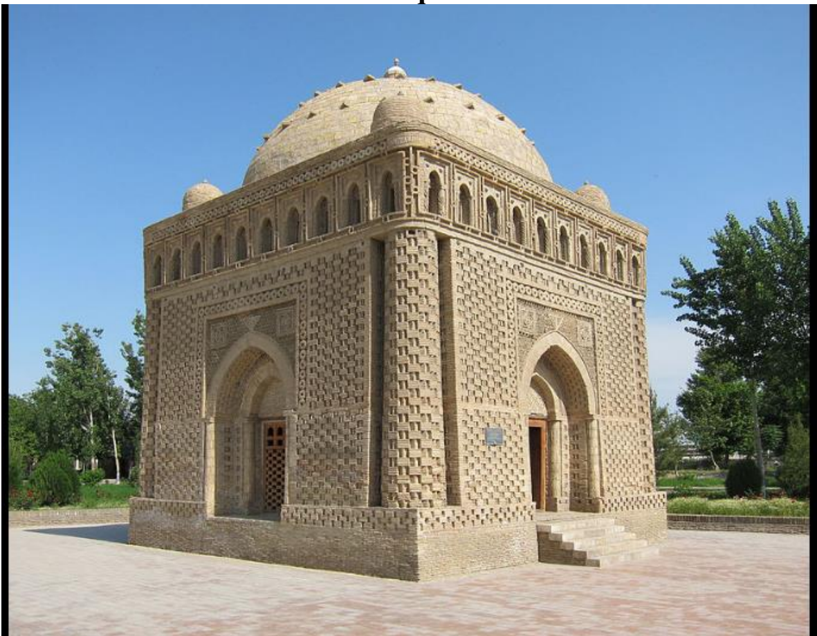
Somoniylar maqbarasi. Buxoro