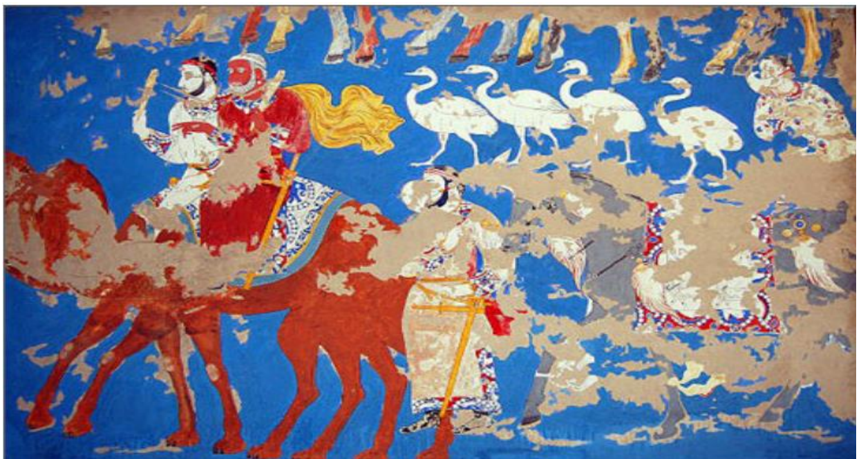
Afrosiyob devorlaridagi VI-VII asrlarlarga oid suratlar