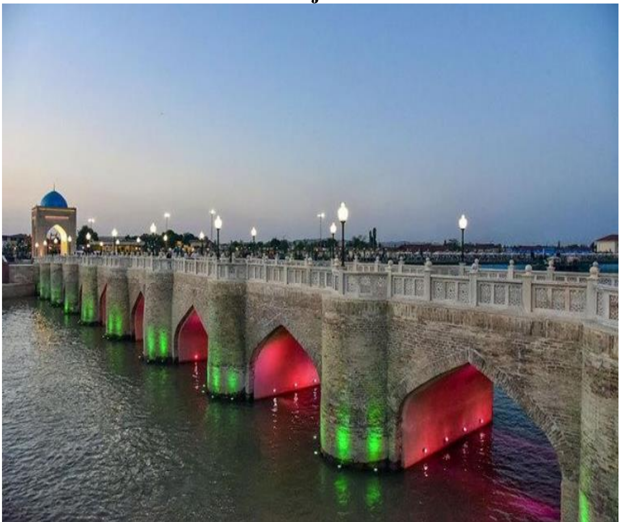
Qashqadaryo ko'prigi. XVI asrning ikkinchi yarmida qurilgan