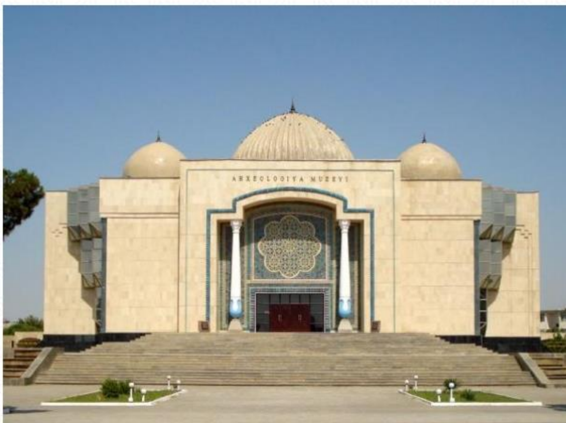
Termiz arxeologiya muzeyi. 2002 -yil 2- aprelda tashkil etilgan