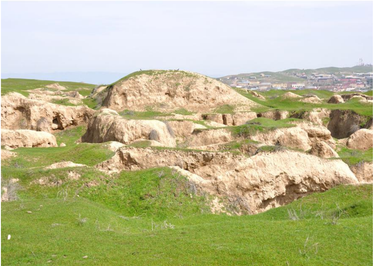
Afrosiyob ko'hna shahar