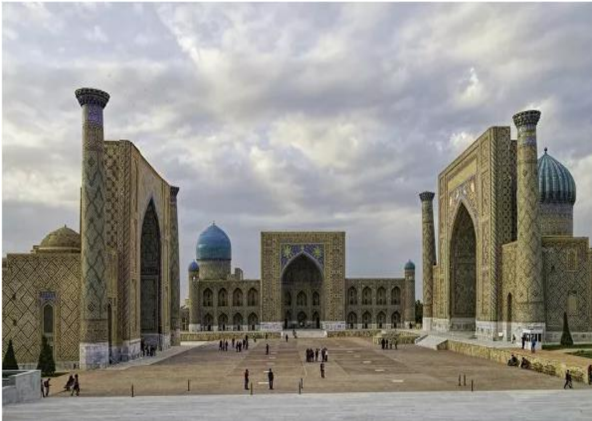
18-oktabr Samarqand shahri kuni