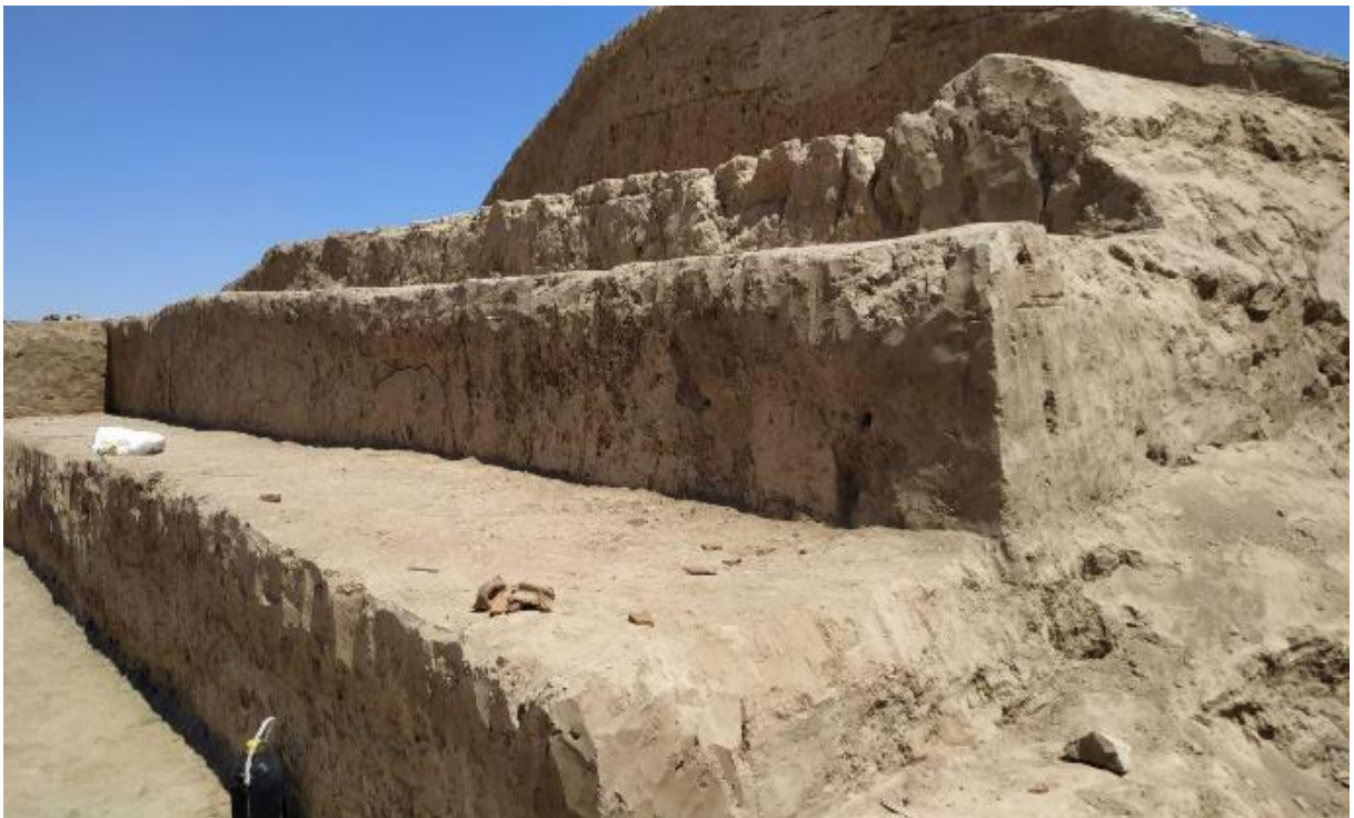
Yerqo'rg'on mudofaa devorlari va quriqchi minorlar o'rni