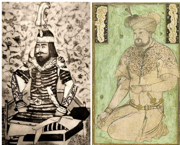
Шарқ рассомлар томонидан яратилган миниатюралар.