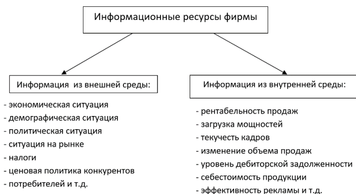
Рисунок. Структура информационных ресурсов.

В моделях фирмы позволило определить фирму, во-первых, как сложную организацию, во-вторых, как открытую систему, выживание которой зависит от внешнего мира. Это и определяет роль информационного ресурса в деятельности фирмы. К целям фирмы относятся получение прибыли, выход на новый рынок, увеличение её долей рынка и др. В этой связи для управления фирмой важно вовремя получать информацию, которая может помочь найти оптимальные пути достижения поставленных целей.