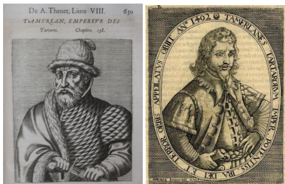
Италян ва француз рассомлари томонидан яратилган Амир Темур образи.

кўриш мумкин. Асарга қараганда дастлаб словатли Амир Темур сиймоси кўзга ташланади. Унинг образи, либоси, ҳатто отининг камарлари кўзга ялт этиб ташланади.