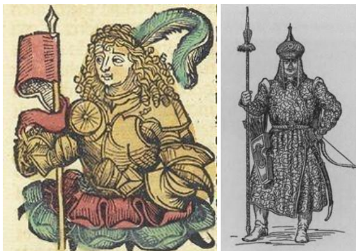
Рембрандт Хармес ван Рейн ва И. Мородан графика усулида яратган образлари.