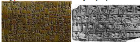
Edubadagi sopol mashq lavhlari