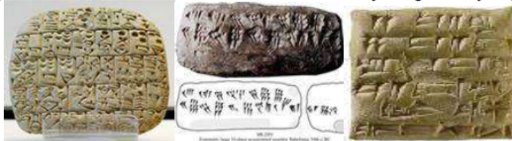
Shumer sopol lavhi

Asosiy qism. Mirzalarni tayyorlovchi dastlabki maktablar “lavhlar uyi” (shummer tilida-eduba) deb nomlangan. Yozuvlar loydan yasalgan, ho’l lavhlar sathiga cho’p qirg’ichlar bilan o’yib bitilgan. So’ngra olovda kuydirilib quritilgan. Eramizdan avvalgi birinchi ming yillikda loy lavhlar, ustiga mum surilgan yog’ochdan yasalgan lavhlar bilan almashirilib, kerakli ma’lumotlar lavh yuzasiga tirnab yozilgan.